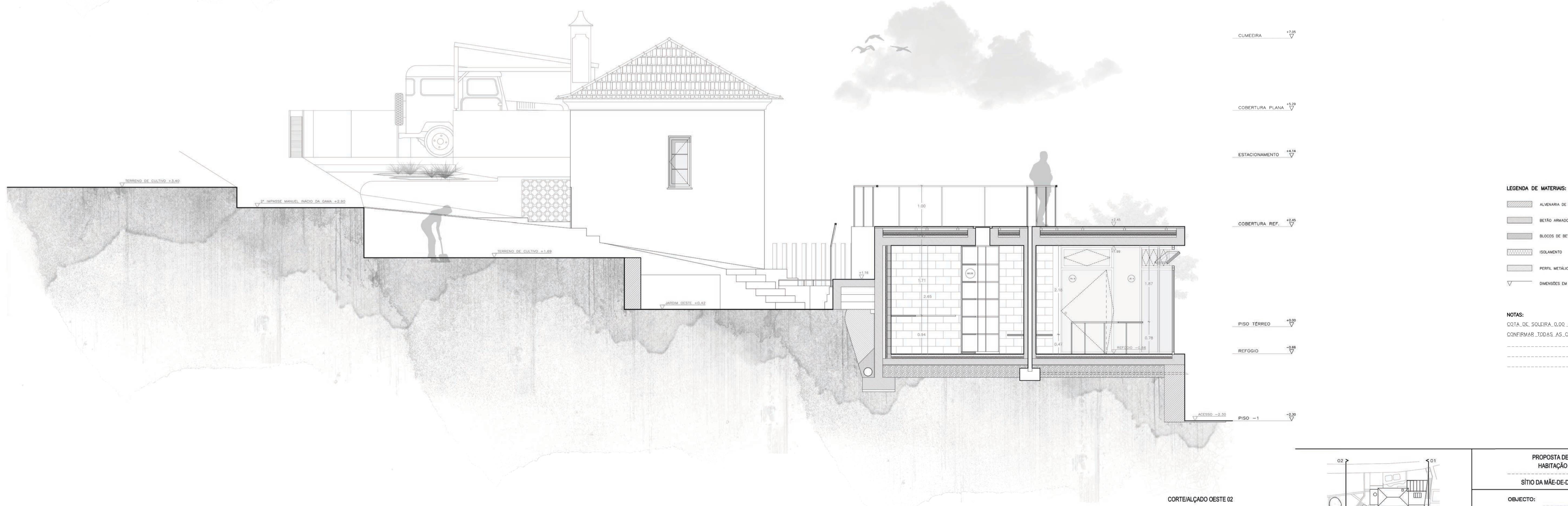
CORTE/ALÇADO OESTE 02