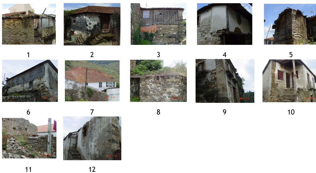
Figura A3.3 - Edifícios da amostra da povoação de Angorês

Na Figura A3.3 apresentam-se os 12 edifícios de tabique incluídos no grupo da povoação de Angorês, localizada na freguesia de Cambres.