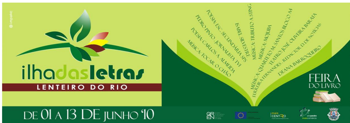
Figura 14 - Cartaz de divulgação da Feira do Livro em São Pedro do Sul