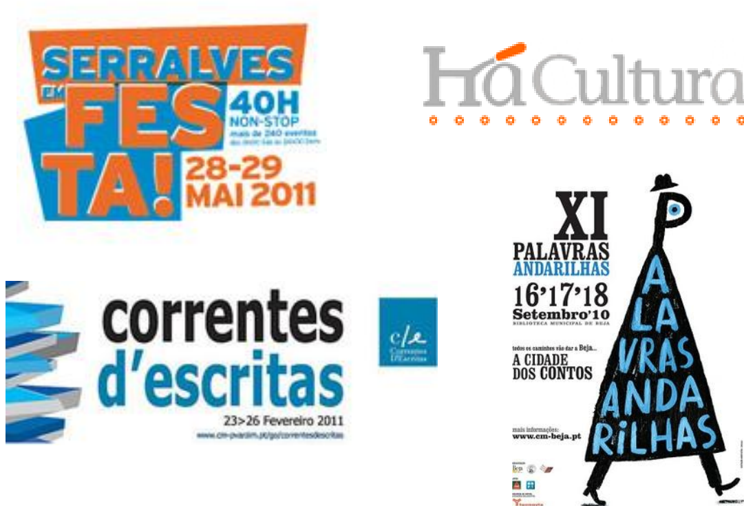
Figura 1 - Alguns exemplos de referência de festas literárias

As comunidades leitoras devem ser desenvolvidas em espaços de cultura e lazer aprazíveis e de bom acolhimento, sendo os ambientes de leitura envoltos em calor humano, entre espaços relativamente pequenos, em baixas mesas, com volumosos pufs e sofás confortáveis, dispostos de forma, a que todos se possam olhar de frente. De preferência, deve haver instrumentos musicais na sala para que se possam intercalar as palavras com alguma musicalidade, crescendo o ar de festa que é ler, ler em grupo, ler em silêncio, porque cantar e tocar enriquece o ambiente, aquece as almas, desperta corações e estimula palmas. Acresce, assim, naturalmente, o prazer que a leitura proporciona, bem como a fruição cultural. Actualmente em Portugal há cidades e locais onde se tornaram constantes edições de elevados momentos de cultura associados à leitura e ao prazer que nos desperta.