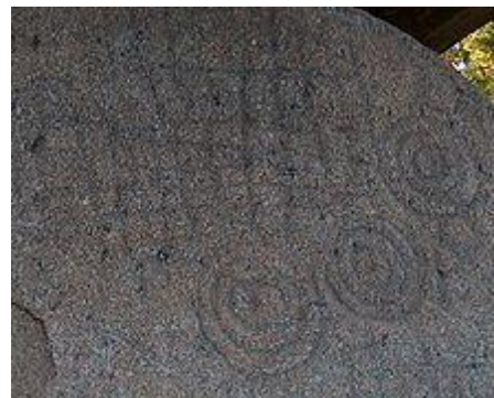
Figura 2 - Pedra Escrita de Serrazes, concelho de São Pedro do Sul

Devido ao estilo de sociedade em vigor, em que há crescimento e rapidez com tudo o que se desenvolve, também o ensino e aprendizagem não se podem cingir ao aumento de competências instrumentais, mas mais, a tornar os indivíduos capazes de se desenvolverem como cidadãos, consumidores e produtores, compreendendo as mudanças do mundo e os efeitos consequentes de cada sujeito.