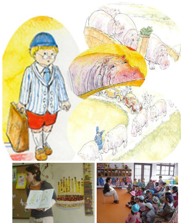
Figura 4 - Hora do Conto “O Rapaz dos Hipopótamos” no Jardim-de-Infância de Santa Cruz da Trapa

“Um hipopótamo seguiu um rapazinho da escola até casa: no dia seguinte havia dois hipopótamos; todos os dias chegavam mais hipopótamos. O pai procurou uma bruxa para dar ao rapaz um remédio anti-hipopótamos, mas...”