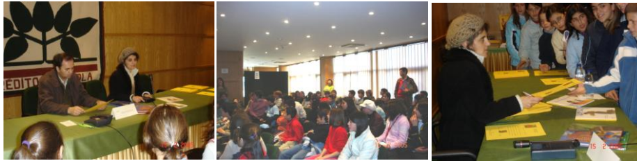
Figura 3 - Acção com a escritora Sara Monteiro e os alunos do 2º ciclo dos Agrupamentos de Escolas do Concelho

Passamos a referir alguns exemplos de práticas de leitura desenvolvidas pela Câmara Municipal de São Pedro do Sul, através da Biblioteca, em colaboração com os agrupamentos das escolas de São Pedro do Sul e Santa Cruz da Trapa, que aderiram às “Olimpíadas da Leitura”, promovidas pelo Instituto Português do Livro e das Bibliotecas . Trata-se de um concurso que permitiu aos alunos ler uma obra seleccionada, por concelho e falar sobre ela directamente com a escritora tendo que elaborar um trabalho individual segundo regulamento próprio.