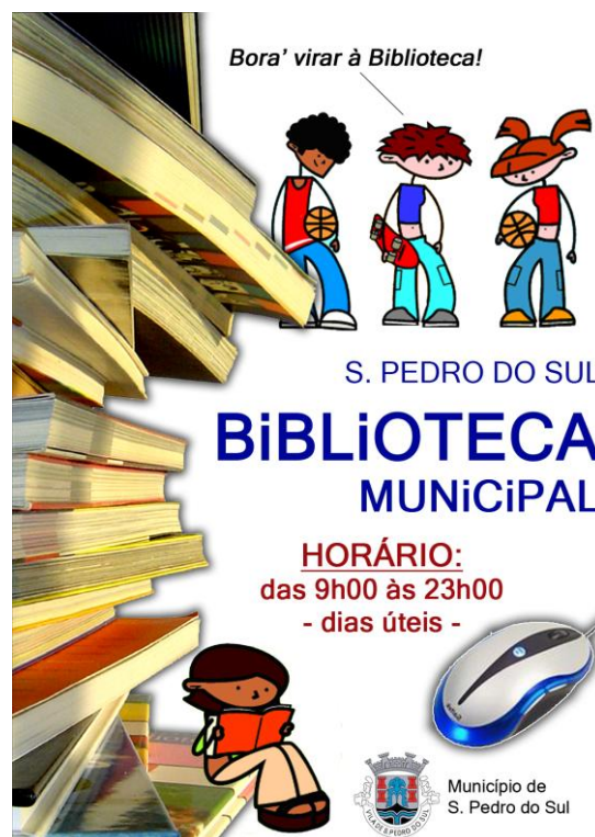
Figura 10 - Cartaz informativo sobre o alargamento do horário da Biblioteca Municipal, durante o Verão

Apresentamos alguns exemplos sobre a importância que a promoção do livro e da leitura constituem para o Município de São Pedro do Sul, a começar pelo horário alargado de funcionamento da Biblioteca durante os meses de Verão.