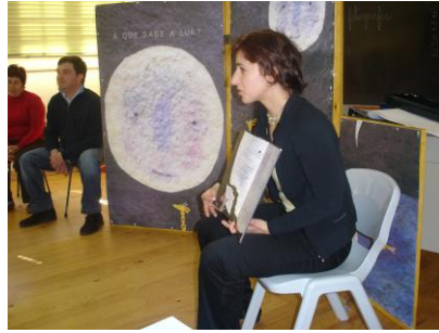
Figura 5 - Hora do Conto “A Que Sabe a Lua” na Biblioteca Municipal

A história o “Gigante Egoísta” de Óscar Wilde, percorreu as escolas do 1º Ciclo do concelho. De referir que, o fim do conto foi adaptado, sendo proposto no final aos alunos que lessem o livro e verificassem o final original da história. Louvamos a iniciativa de alguns professores que trabalharam o conto na sala de aula com os alunos, bem como outros que atribuíram, como trabalho de casa, recontar, por escrito, e eles próprios encontrarem um outro fim para a história.