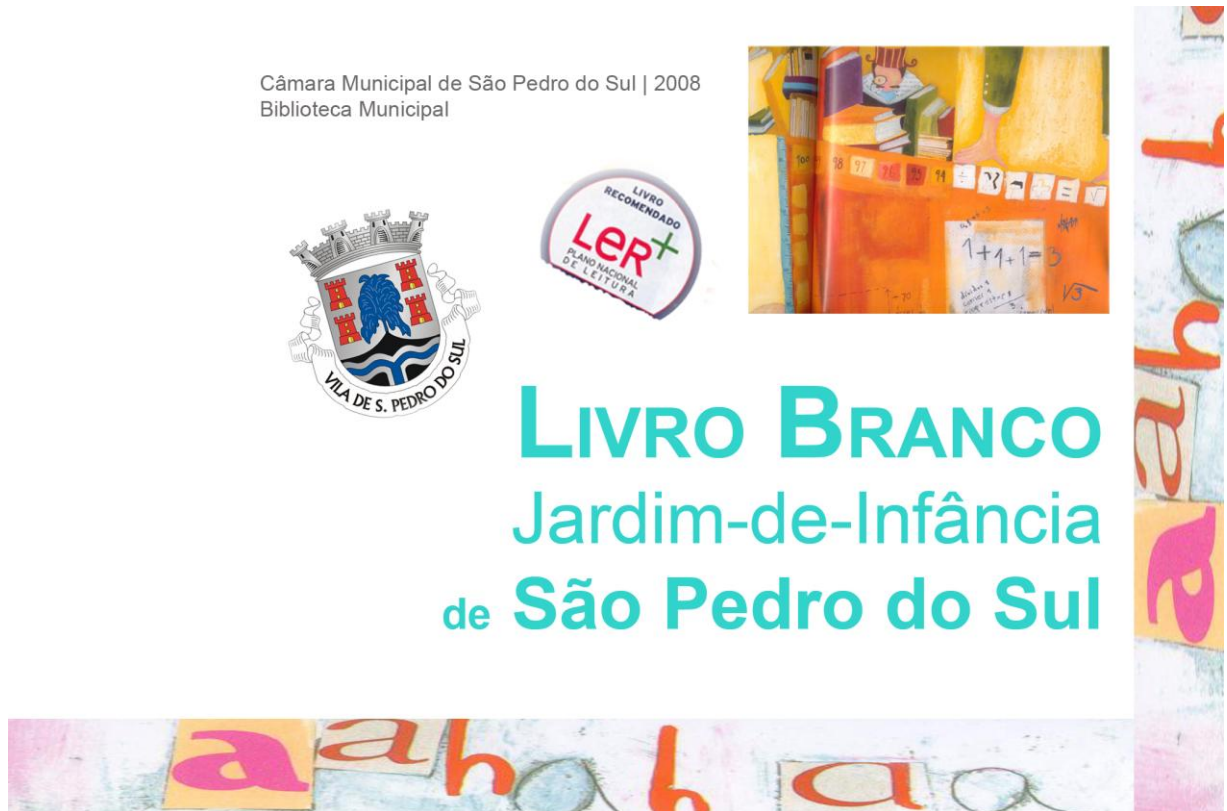
Figura 13 - Capa do “Livro Branco” proposto a todos os Jardins-de-Infância do concelho, que os preencheram tendo sido expostos na Feira do Livro, no final do ano lectivo