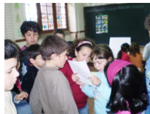
Figura 7 - Hora do Conto seguida de actividades desenvolvidas na Escola do 1ºCEB de Vila Maior

A Biblioteca Municipal através do Instituto Português do Livro e da Biblioteca conseguiu deslocar a São Pedro do Sul - A Noite de Natal de Sophia de Melo Breyner Anderson, protagonizada pelo actor Paulo Lages. Esta obra integra o Plano Nacional de Leitura e destinou-se aos alunos do 5º e 6º anos, já que se insere no programa escolar de Língua Portuguesa, destes anos lectivos. O profissionalismo, do actor, revela-nos como é extraordinário trabalhar com crianças em literatura, por vezes, menos agradável para os alunos destas idades, algo complexas por natureza, acrescido o facto de, como sabemos o gosto e o hábito de leitura ainda estarem pouco incutidos nos jovens. Esta actividade constituiu, com toda a certeza, uma experiência inesquecível, para todos aqueles alunos presentes no auditório. Não se tratou propriamente de um espectáculo, mas sim de um momento de leitura e alguma encenação em que estiveram em palco a trabalhar com o actor vários alunos cuja experiência, acreditamos, os marcará para sempre.