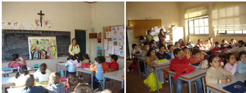
Figura 6 - Hora do Conto “O Gigante Egoísta” na Escola do 1º CEB de Bordonhos

A história o “Gigante Egoísta” de Óscar Wilde, percorreu as escolas do 1º Ciclo do concelho. De referir que, o fim do conto foi adaptado, sendo proposto no final aos alunos que lessem o livro e verificassem o final original da história. Louvamos a iniciativa de alguns professores que trabalharam o conto na sala de aula com os alunos, bem como outros que atribuíram, como trabalho de casa, recontar, por escrito, e eles próprios encontrarem um outro fim para a história.