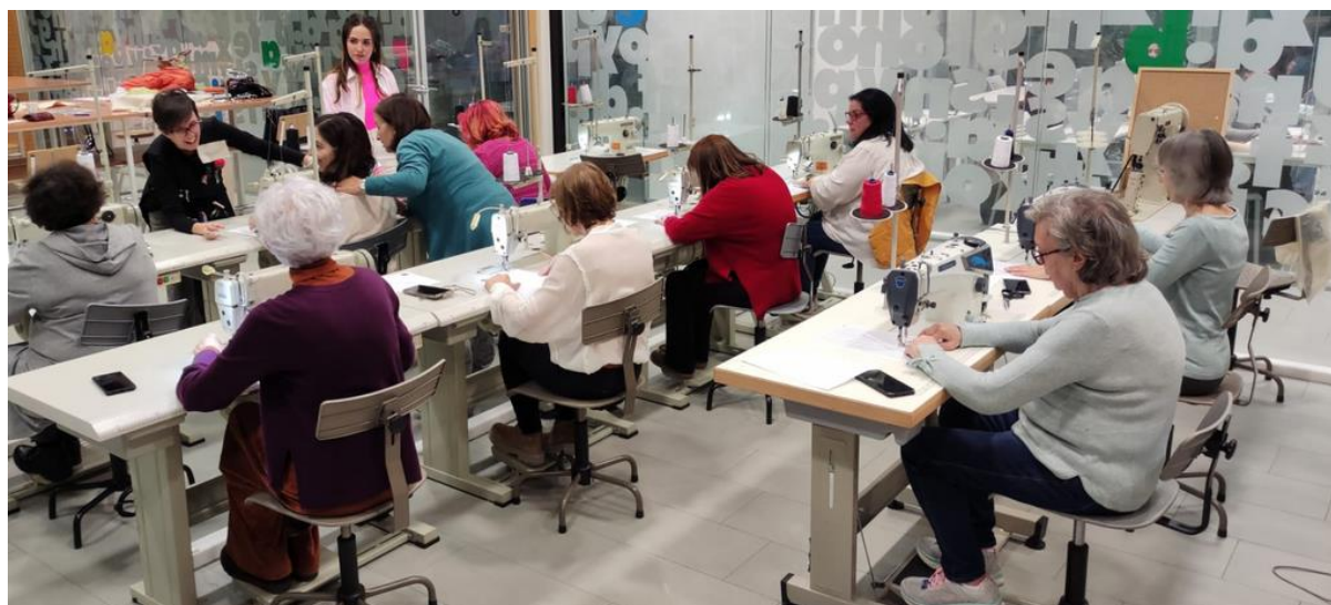
Figura 4. Empoderando mulheres maduras através do upcycling: As oficinas da Vintage for a Cause.