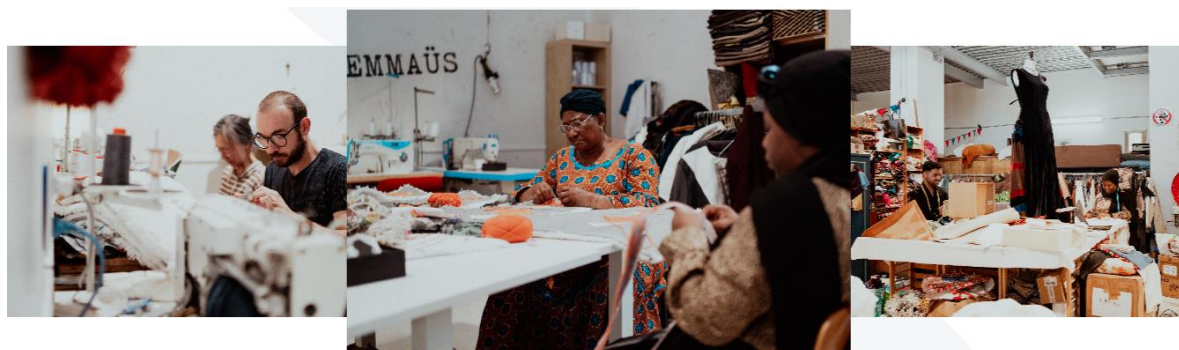
Figura 7. Emmaüs Défi: Transformando doações em criações únicas e eco-responsáveis para promover a integração social