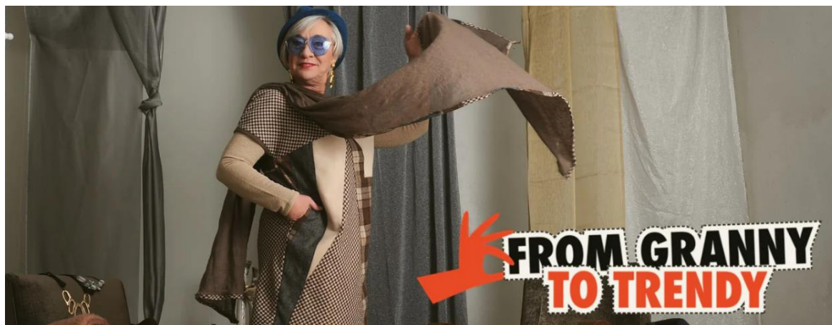
Figura 3. Programa de Envelhecimento ativo e capacitação para mulheres acima dos 50 anos fora da vida ativa.