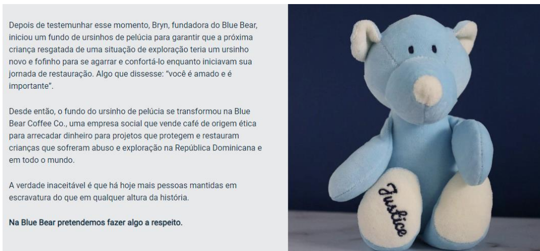
Figura 2: Chamada para conscientização sobre o tráfico humano e o compromisso da Blue Bear Coffee