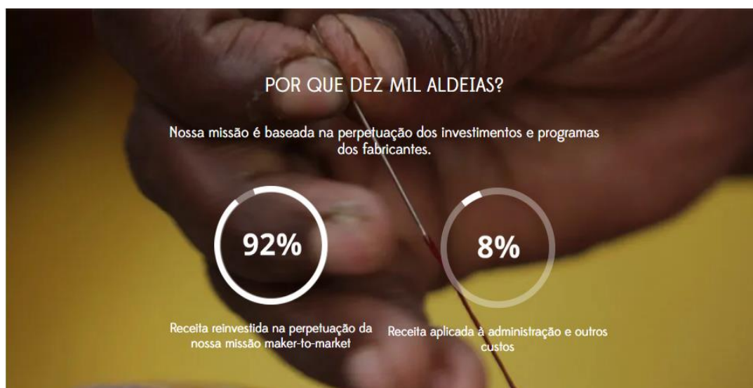
Figura 6. Confiança e transparência no comércio justo: A proposta da Ten Thousand Villages