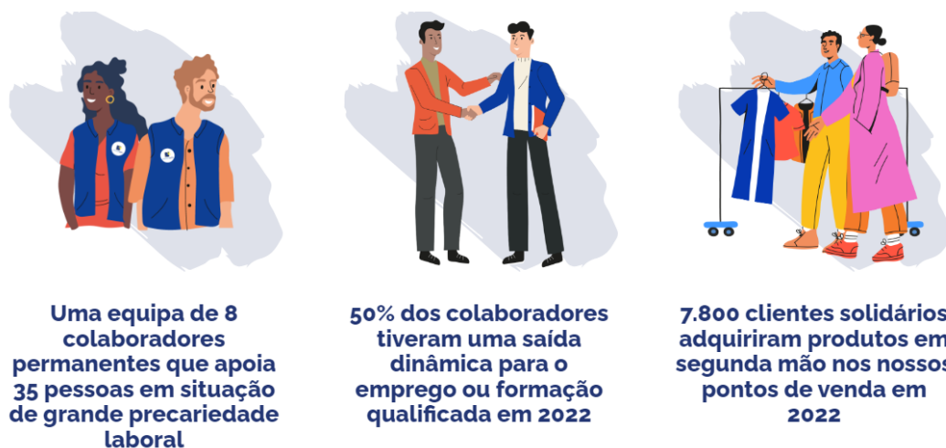
Figura 8. Campus Emmaüs – Luta contra a precariedade entre os jovens