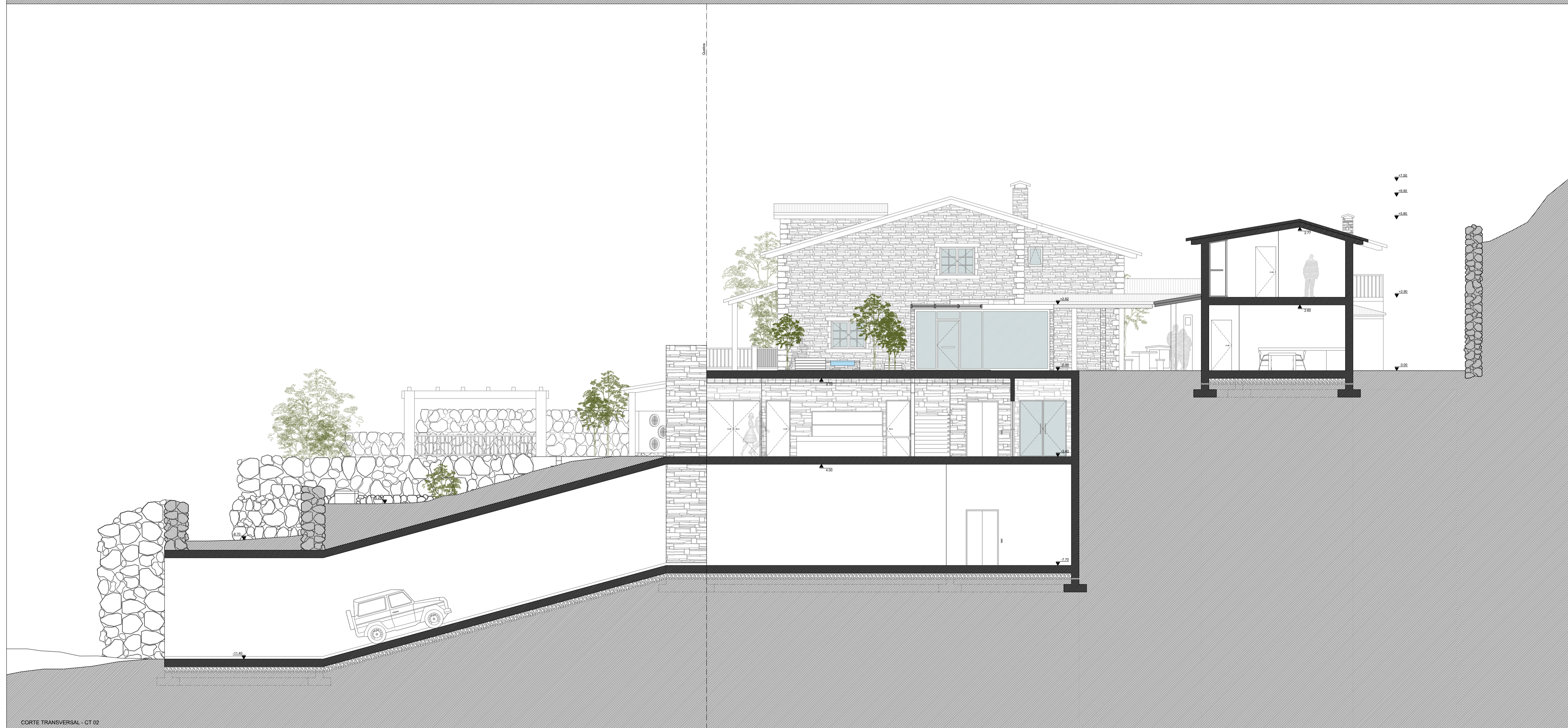
CORTE TRANSVERSAL - CT 02