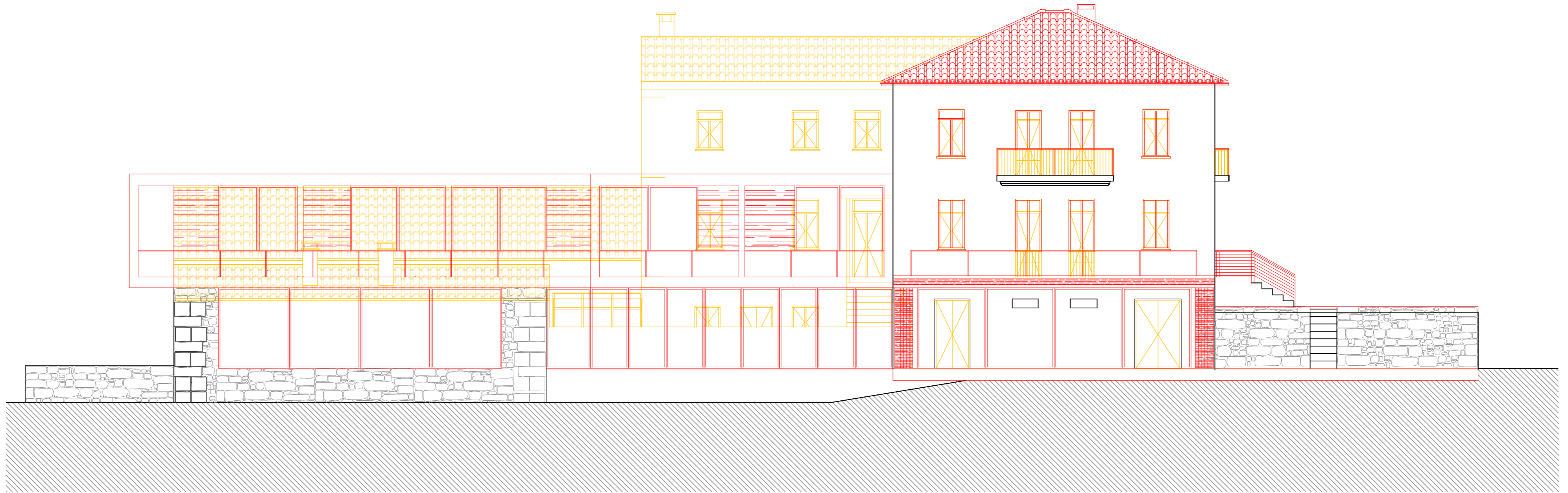
Alçado Sul Existente