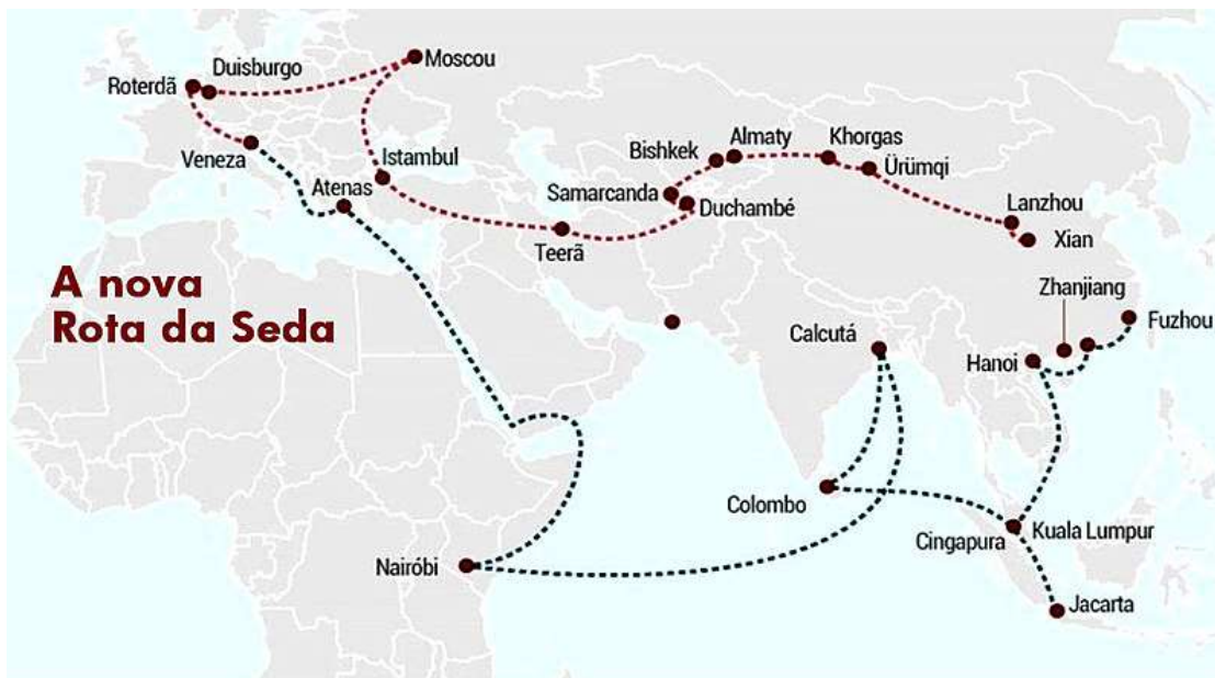
Figura 1: As rotas da Seda

De acordo com a Figura 1, podemos observar as rotas utilizadas e a abrangência da Rota da Seda durante esse período, trazendo como consequências a interculturalidade e o avanço econômico entre ambas as regiões.