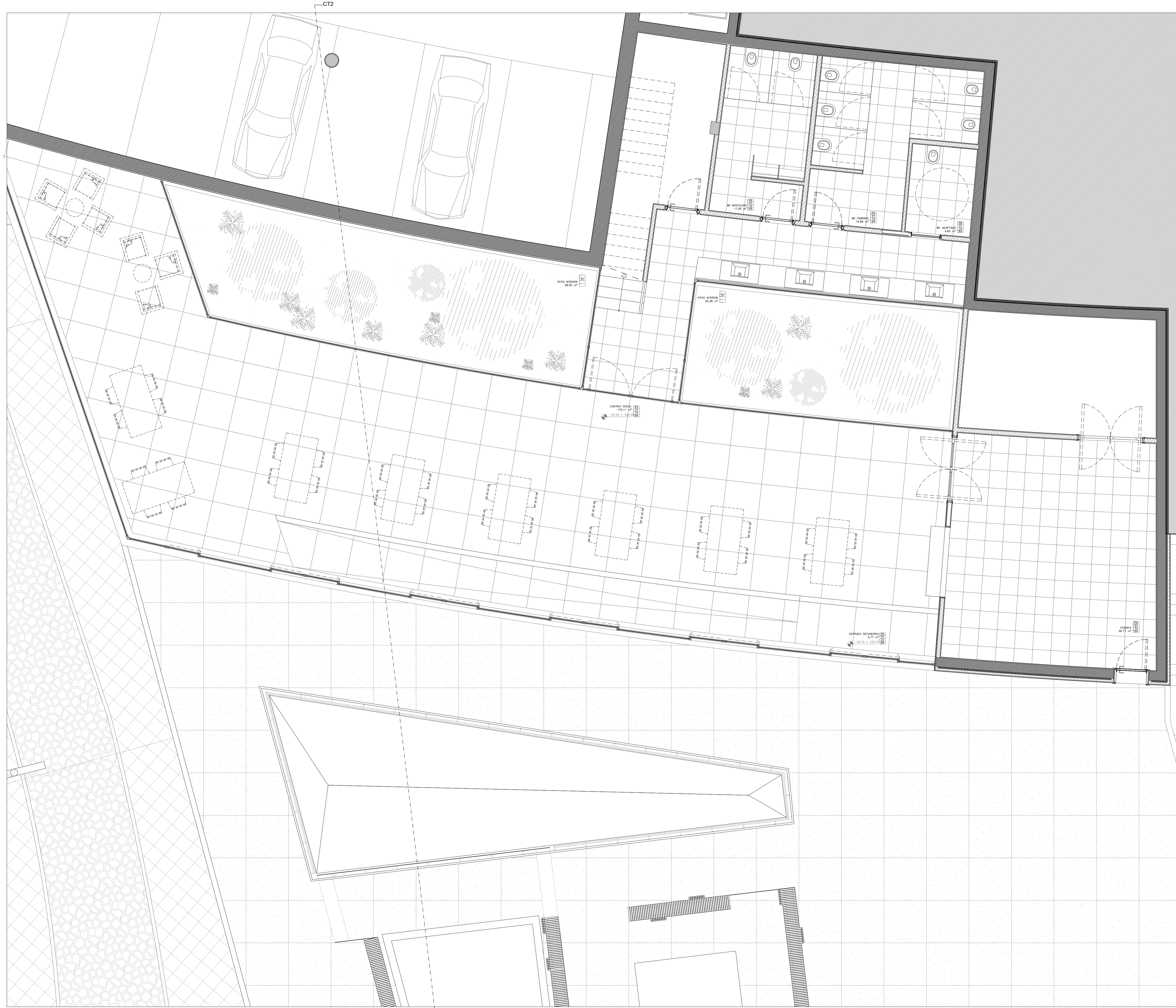
PLANTA DA CANTINA SOCIAL

Reprodução proibida. De acordo com o artigo 17.º do Decreto-Lei n.º 42/85 de 17 de Maio e o artigo 1.º do Decreto-Lei n.º 111/99 de 18 de Junho, a reprodução ou utilização para fins comerciais é proibida. Reservados todos os direitos de autor.