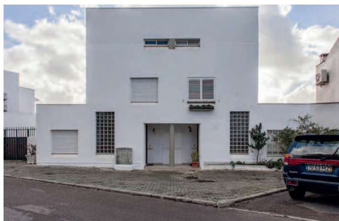
FIG. 7 Acessos às habitações unifamiliares com caixa de correio coletiva da SOCASA, Azambuja, 2017 (Duarte Cabral de Mello e equipa). João M Almeida