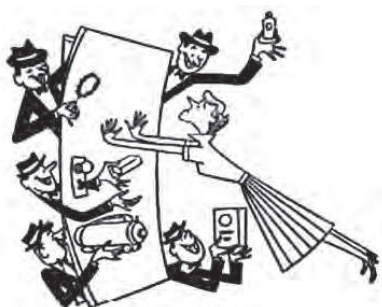
FIG. 4 «A mulher opõe-se aos intermediários mas só o cooperativismo lhe dará a força que precisa para resistir.» Boletim Cooperativista , n.º 36, setembro de 1956, p. 4

manual de instruções de como um sócio percorre o regulamento cooperativo até ao momento de receber a sua casa, fixando, de modo claro, os papéis no interior da família e da sociedade.