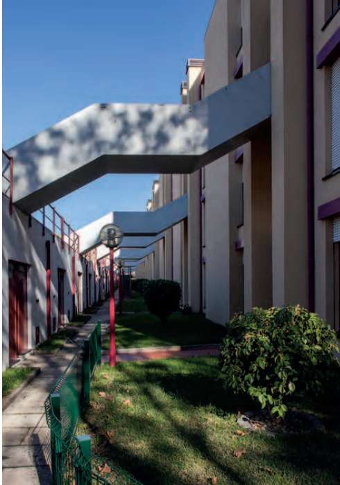
FIG. 14 Acesso entre volumes de garagens e de habitações da Cooperativa de Habitação Gente do Amanhã, Senhora da Hora, Urbanização do Seixo, 2017 (José Pulido Valente, 1985). João M Almeida