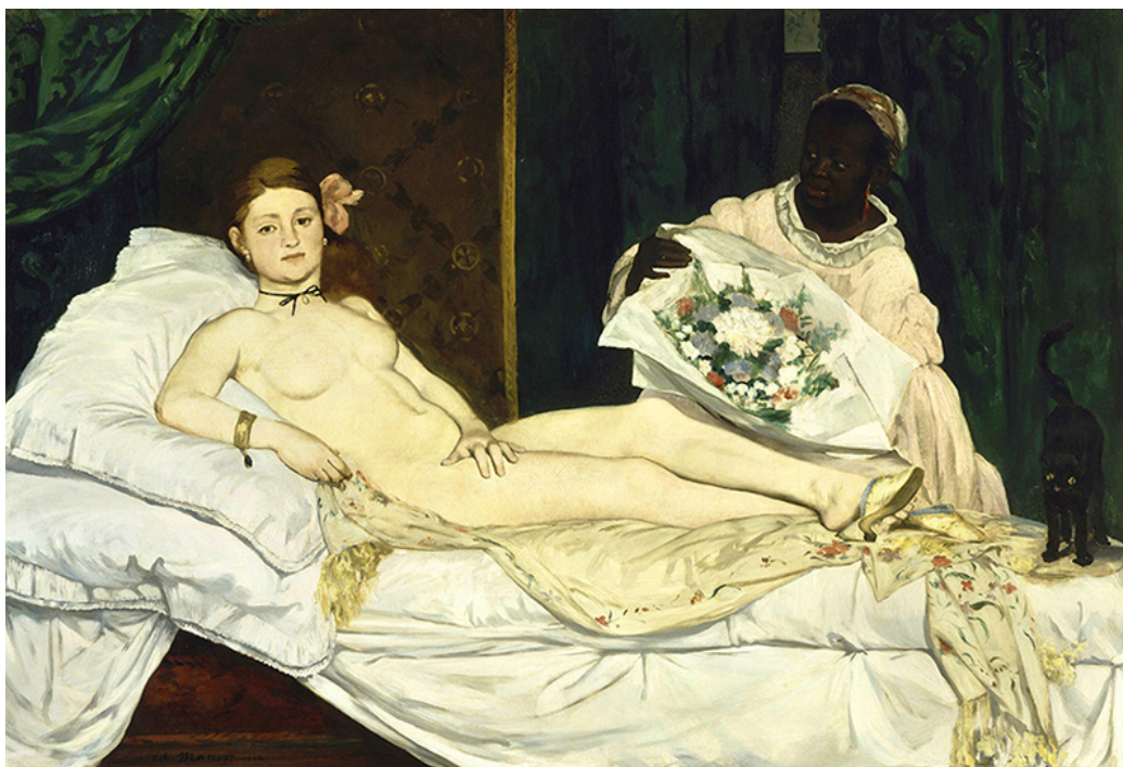
Fig. 2 - Edouard Manet, Olympia , 1863

Sem obviamente diminuir a importância de outras citações à Venere , é sobretudo na irreverente Olympia (1863), de Edouard Manet (1832-1883), que encontramos um modelo provocativo de referência para gerações futuras (Fig. 2). Exposta no famoso Salon des refusés , em 1865 e no que poderia ser o mais improvável dos locais, dada a natureza peculiar deste Salon , é alvo de uma indignação sem precedentes, com a exigência para a sua retirada imediata. Apesar da sua consciência masculina, em que apresenta claramente uma visão da carne e do prazer, é paradoxalmente, uma obra subversiva que sustenta ser incorporada na denúncia do esconder uma actividade tão pública e tão marginal como a prostituição. Na sua composição, existem alguns adereços reconhecidos do imaginário pornográfico, como a orquídea no cabelo ou o laço à volta do pescoço, acentuando a nudez e a sexualidade, e como a Venere , o olhar directo para o espectador é o seu atributo provocatório mais mencionado.