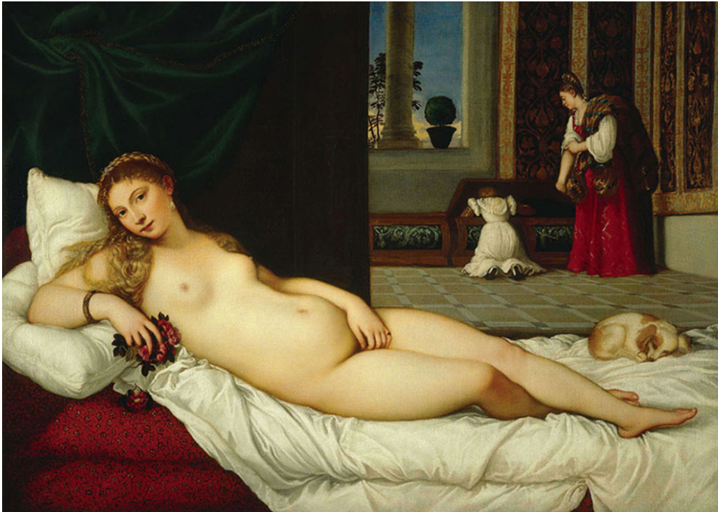
Fig. 1 - Tiziano, Venere di Urbino , 1534-36

Contudo, a Venere não se encaixa formalmente no programa de referências mitológicas clássicas e mesmo o título, tão construtor, só mais tarde lhe foi atribuído. Representa, na sua composição e de modo notável a sensualidade e beleza femininas, para além da suficiente carga provocativa acumulada e pela qual desafiou os limites da época, sobretudo na construção de uma relação espontânea com o seu espectador/ voyeur , através da inesperada representação do olhar directo da modelo, contrastando com outras obras similares da época, que se apresentavam de olhos cerrados, como a Venere dormiente ou Venere di Dresda (c. 1510), de Giorgione (1477-1510), da qual emerge, e uma forte referência para outras obras que adoptaram um programa temático semelhante, como La grande odalisque (1814), de Ingres, estruturada sobre desenhos de Giorgione e Tiziano, ou igualmente na composição do Portrait de madame Récamier (1800), de Jacques Louis David (1748-1825).