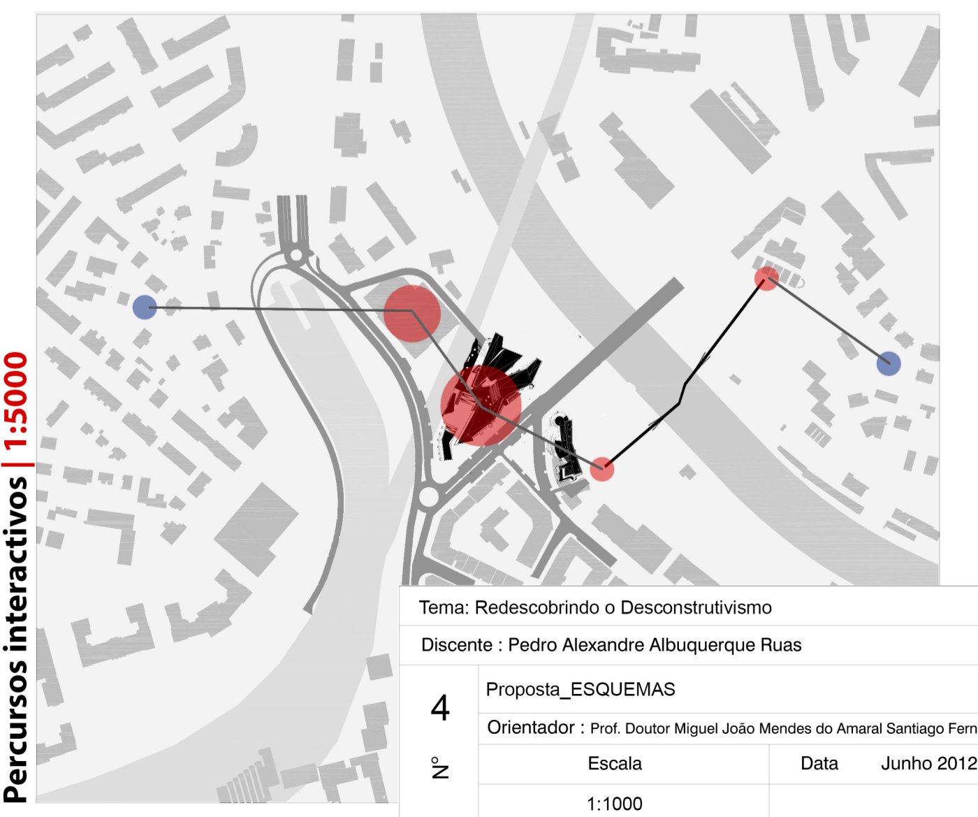
Percurso interactivos | 1:5000