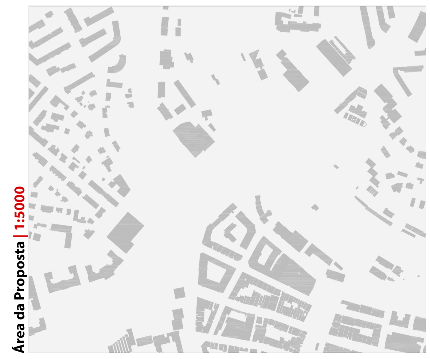
Área da Proposta | 1:5000