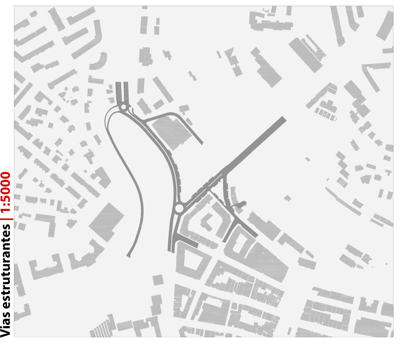
Vias estruturantes | 1:5000