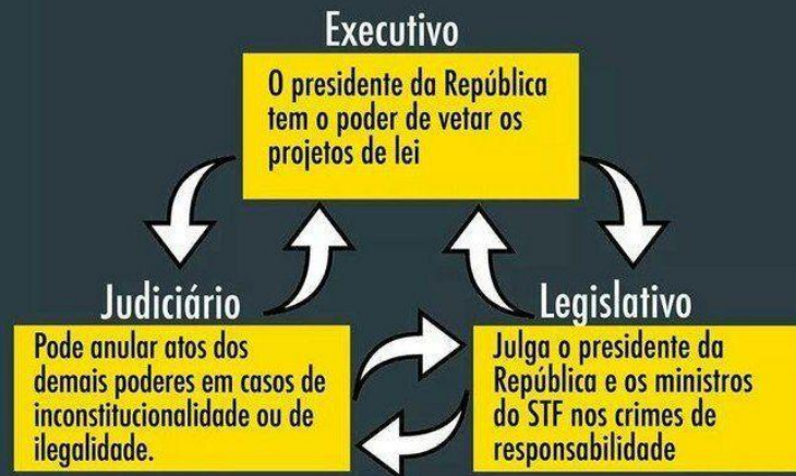
Figura número 2: Funcionamento dos Freios e Contrapesos.

Da expressão em inglês "checks and balances". É o sistema em que o Executivo, o Legislativo e o Judiciário se controlam mutuamente para evitar abusos de poder.