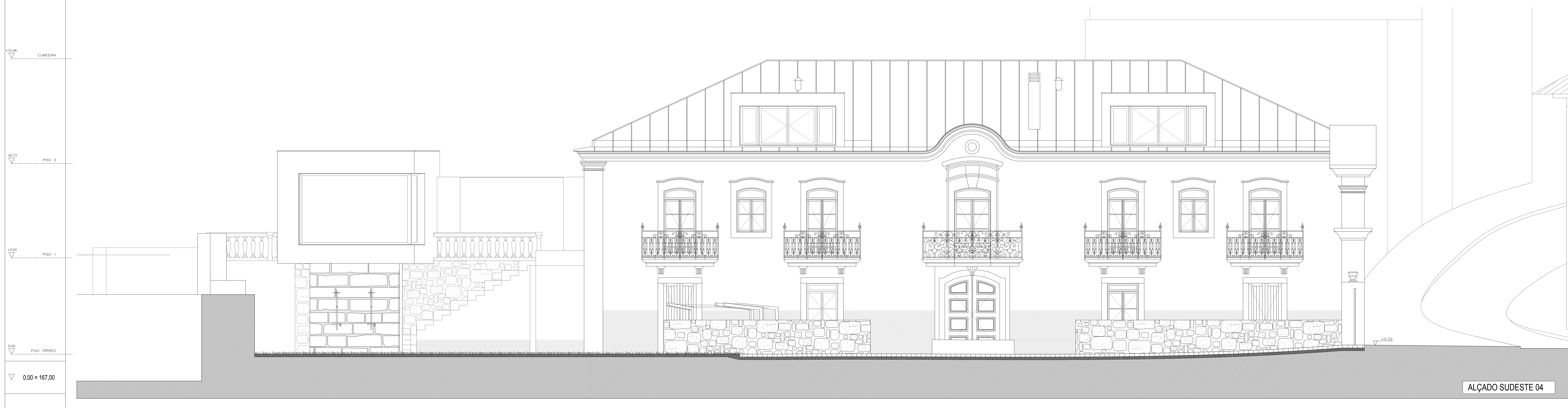
ALÇADO SUDESTE 04