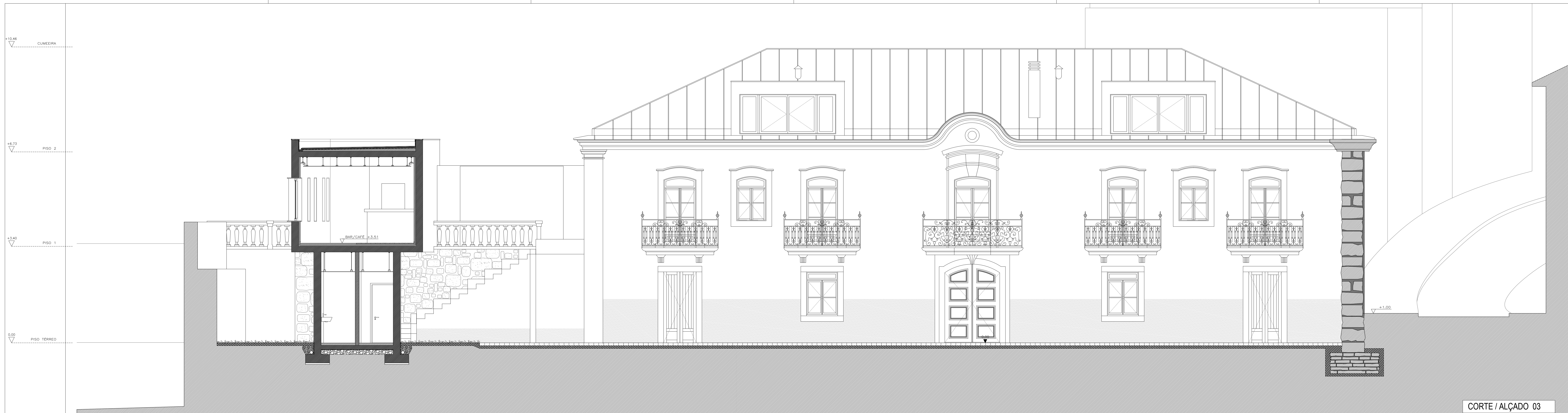
CORTE / ALÇADO 03