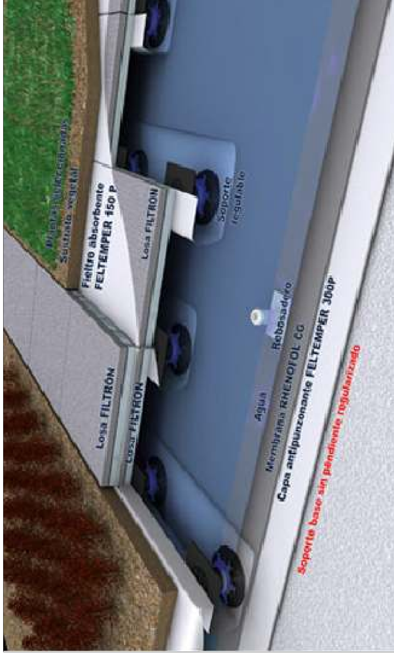
Imagem representativa da constituição da cobertura