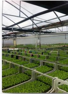
Tabuleiros com sementeira (motes)