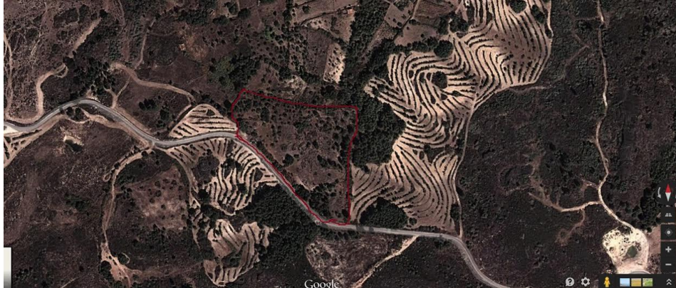
Ilustração 11 Cobertura espacial 10