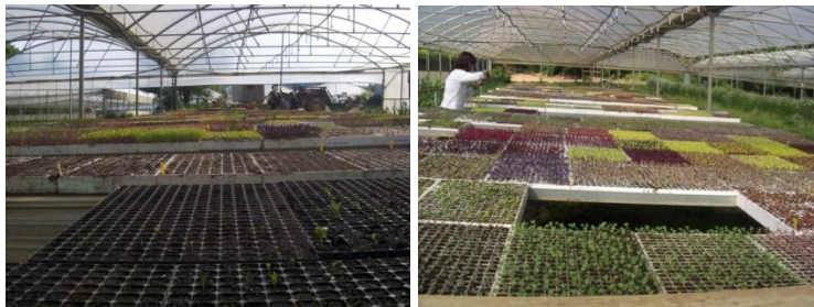
Tabuleiros em diversas fases de desenvolvimento das plântulas