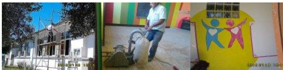
Ilustração 3 Requalificação Sede Social

O dia 28 de Agosto de 2009, ficou marcado pela constituição legal da Associação Solidariedade Sem Fronteiras, entidade que tem vindo desde então a constituir-se como uma entidade ativa no combate à exclusão e pobreza social, com maior incidência no concelho de Penamacor, a qual se constitui como um pilar de apoio social neste concelho (Ilustração 3).