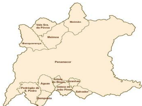
Ilustração 1 Mapa Concelho de Penamacor 2

Conjuntamente com os concelhos de Vila Velha de Ródão, Castelo Branco, Oleiros, Vila de Rei, Sertã, Proença-a-Nova, Covilhã, Fundão, Belmonte e Idanha-a-Nova, o concelho de Penamacor pertence ao distrito de Castelo Branco. A Sul o concelho é limitado pelo concelho de Idanha-a-Nova, a norte pelo concelho do Sabugal e a Oeste pelo concelho de Fundão, como podemos observar na ilustração 1.