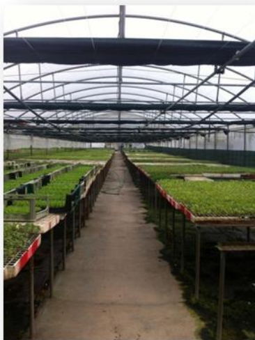
Estufa de produção mudas, corredores em cimento