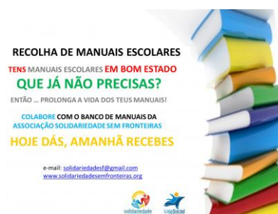
Ilustração 6 Cartaz Banco de Livros Escolares