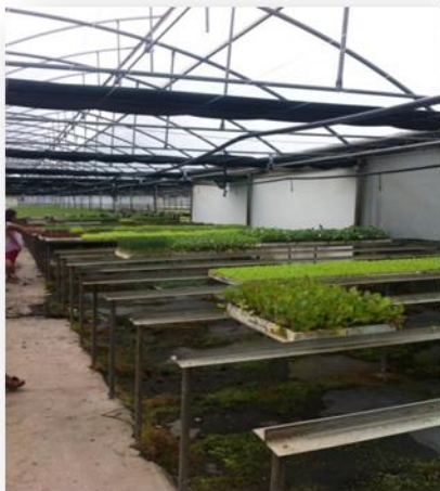
Sistema de rega automática

Produtor de mudas para Modo de Produção Integrada