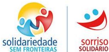
Ilustração 7 Logotipo Sorriso Solidário