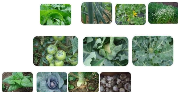
Ilustração 10 Variedades regionais de hortícolas

A gama de produtos da “Semente Solidária” vai ser constituída, por variedades regionais de hortícolas como podemos observar na ilustração nº 10. Esta escolha surge no âmbito da informação recolhida/discutida na formação promovida pela UMP, dado que estas apresentam maior capacidade de adaptação às condições edáfico-climáticas da região, pelo que lhes irá permitir maior taxa de sobrevivência e de crescimento nesses locais e por vezes com menor necessidade de fatores de produção. Dentro da escolha das espécies a cultivar, iremos ter em conta a necessidade de efetuar a prática das rotações culturais. Além do mais, devemos ter em conta que a opção das espécies e cultivares a incluir nas rotações terá que considerar as oportunidades de comercialização, o ciclo cultural da cada cultura (época sementeira/época colheita) e a resistência a doenças e pragas (Mourão, 2007).