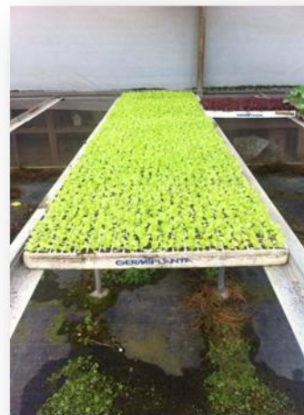
Sistema de bancadas( apoio dos tabuleiros), cobertura solo, tela anti-erva.