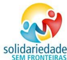
Ilustração 2 Logotipo da ASSF

A Associação Solidariedade Sem Fronteiras foi fundada em Agosto de 2009, caracteriza-se por ser uma associação sem fins lucrativos de âmbito solidário e recreativo 3 . Foi fundada com o objetivo de lutar contra a pobreza e exclusão social e com o intuito de fomentar o desenvolvimento local. A escolha de ser a entidade promotora do projeto “Semente Solidária” pertenceu aos órgãos sociais, pelo fato de se entender que é um projeto socialmente útil e de se constituir como uma mais-valia para a comunidade.