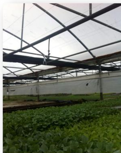
Tela para controlo temperatura