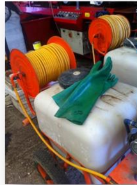
Máquina de lavagem e desinfecção de caixas de tabuleiros