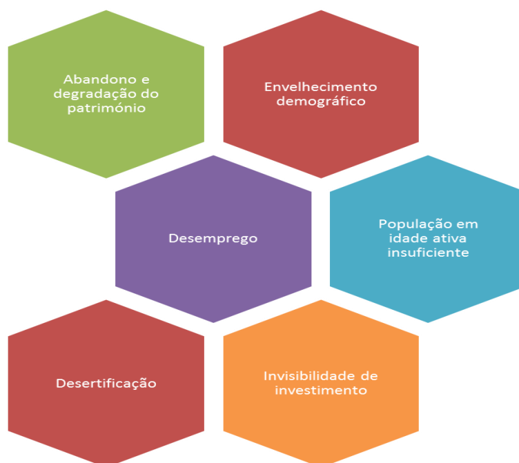
Tabela 1 Resultados da “Chuva de Ideias”- Elaboração própria -

Recorrendo à técnica “chuva de ideias” durante a reunião com os técnicos do gabinete de ação social da Camara Municipal de Penamacor e com os dirigentes da Associação Solidariedade Sem Fronteira, destacaram-se várias problemáticas, as quais destacamos na tabela 1, sendo que na sua maioria já se encontravam referidas no diagnóstico social da autoria da Câmara Municipal de Penamacor. Porém, apesar de constarem no diagnóstico social do concelho de Penamacor, chegou-se à conclusão de que não são tão evidentes, ou melhor, não são devidamente “trabalhadas” no plano de desenvolvimento social do concelho. Os eixos de intervenção mencionados no plano são apenas três, nomeadamente: a intervenção social, maioritariamente com idosos; a valorização do concelho através da divulgação e criação de oportunidades de turismo; e, por fim, a educação/formação ao nível do aumento de ofertas de cursos.