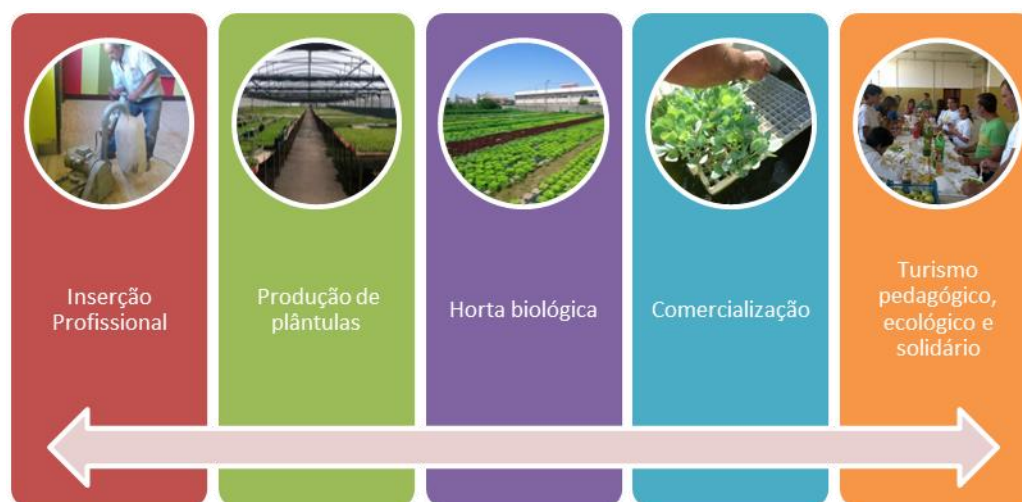
Ilustração 9 Esquemática do projeto Semente Solidária

Neste sentido, o presente projeto incorpora várias dinâmicas/ações as quais se podem observar na ilustração nº 9.