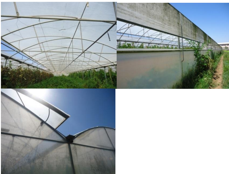
Sistema de abertura de estufas