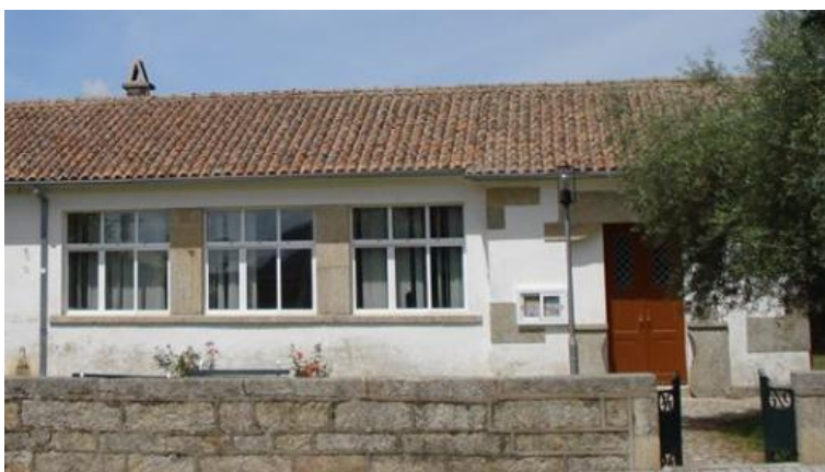
Ilustração 8 Sede Associação Solidariedade Sem Fronteiras

A Associação Solidariedade Sem Fronteiras é sediada na Aldeia de João Pires, nas antigas escolas primárias (Ilustração 8). O edifício foi remodelado e está agora dividido em três espaços diferentes, nomeadamente numa sala de formação/espço net, escritório e armazém social. Importa ainda referir que em Penamacor, na praça municipal, se situa a Loja Social que dá apoio social a todo o concelho em articulação com agentes locais.