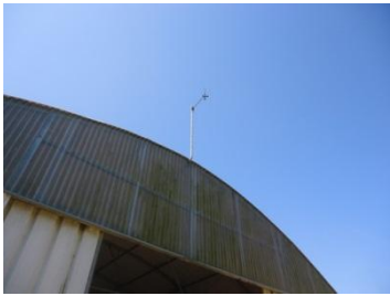
Sensor temperatura estufa