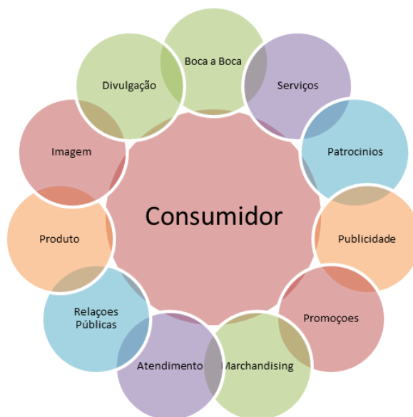
Tabela 3 Comunicação Integrada de Marketing 11

necessidade resulta na promoção do produto. O principal produto da marca “Semente Solidária” (plântulas e produtos hortícolas) estará sempre associado a uma política de Marketing Social. O Marketing Social será o meio que permitirá o aumento da notoriedade da marca e do respetivo produto. Numa primeira instância, a finalidade da compra será atingida canalizando o potencial comprador até ao produto com o chamariz da “solidariedade”. Numa segunda instância, a valorização do produto basear-se-á na sua qualidade de cariz biológico. A Comunicação Integrada representada na tabela nº 3 será uma das estratégias de promoção, pois tudo o que a entidade/empresa fizer resulta na comunicação de algo a seu respeito, logo, irá produzir maior consistência na mensagem, maior impacto sobre as vendas e melhor utilização do orçamento Faria (2002). Desta forma, perspectiva-se que com a utilização da estratégia da Comunicação Integrada e com o processo de produção, aliado a uma marca solidária, se alcance a conjugação perfeita de mais-valias que levarão o produto ao sucesso.