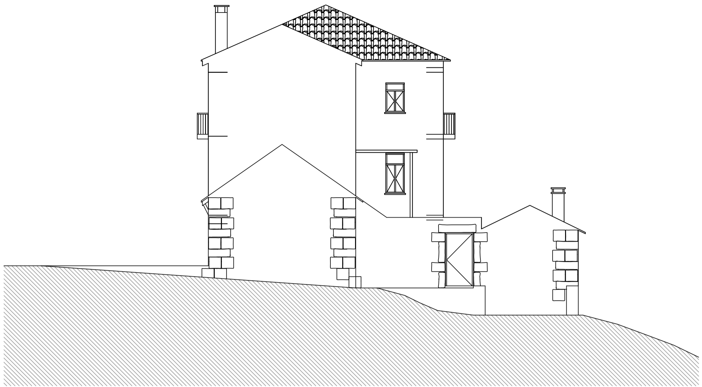
Alçado Poente Levantamento