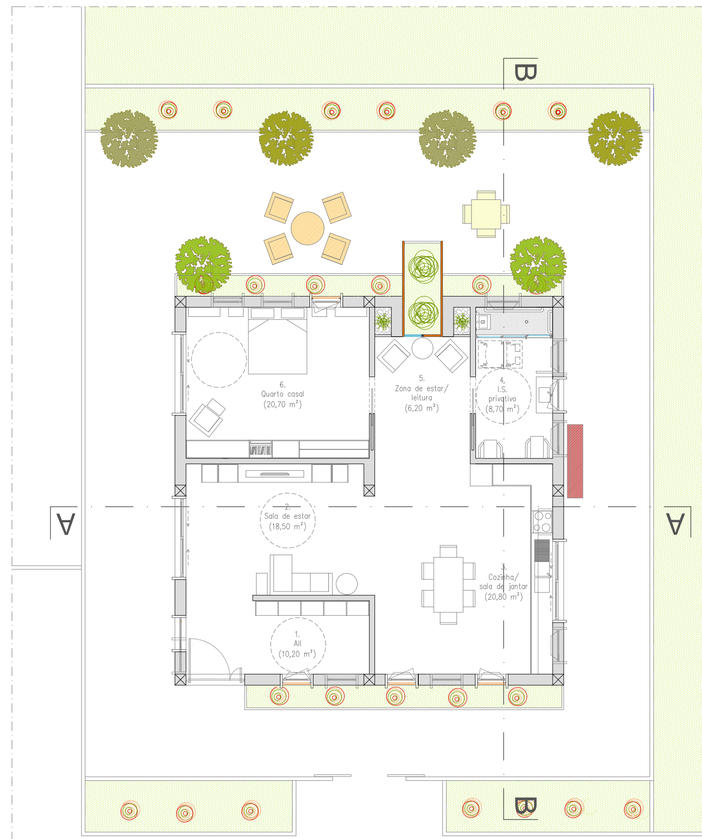
Planta de rés-do-chão_Alojamento_1