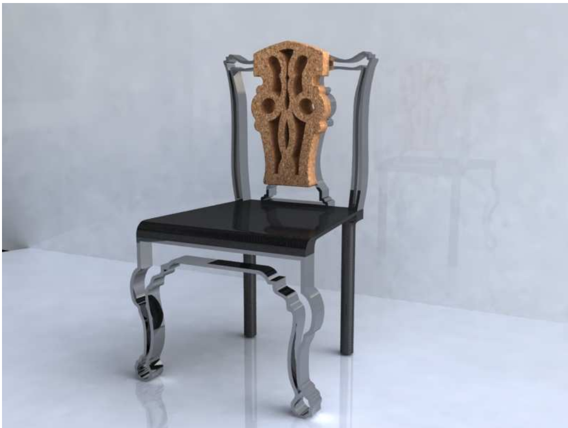
Figura 5.3. – Proposta escolhida para a aplicação das juntas coladas.