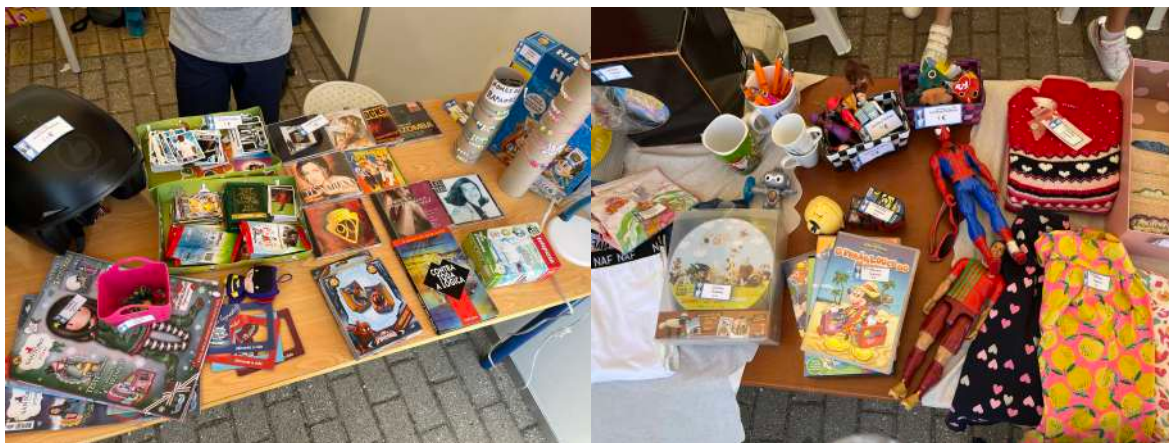
Figura I. Produtos que estavam para venda no “Projeto da Troca Circular”

A avaliação da disciplina de Educação Financeira, é feita de forma qualitativa, consoante a evolução dos alunos desde o início até ao fim do ano lectivo. Sendo esta atividade o resultado de todos os conteúdos lecionados durante as aulas, a avaliação da atividade do Projeto da Troca Circular foi feita consoante o trabalho, entusiasmo e empenho dos alunos na realização desta atividade.