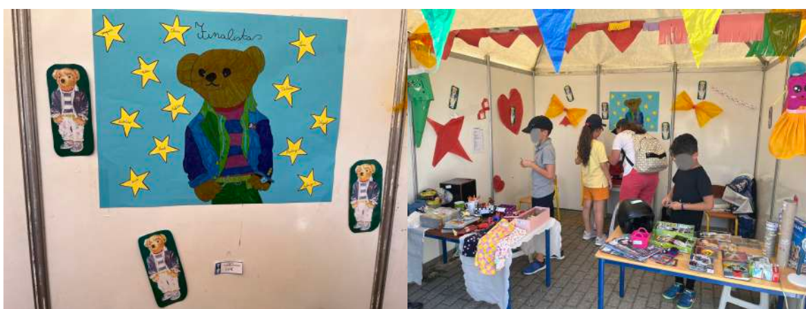
Figura II. Cartaz e Barraca da feira no “Projeto da Troca Circular”