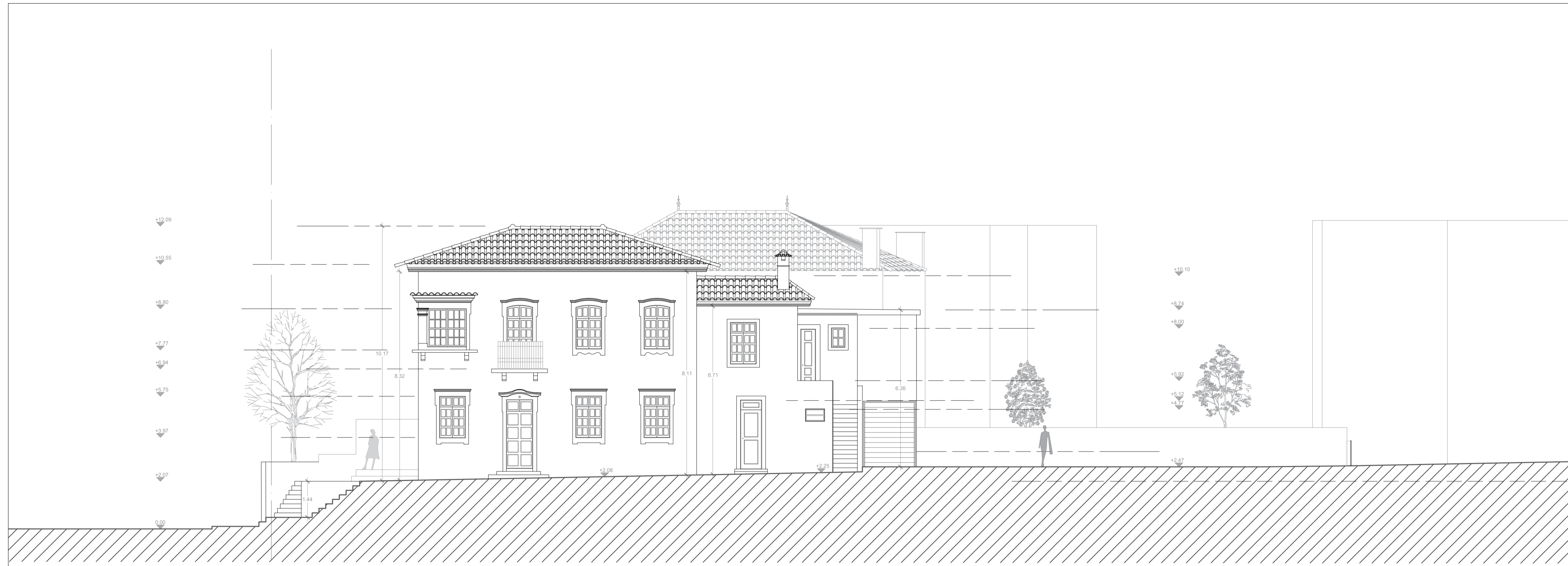
CORTE ALÇADO NASCENTE AA' ESC: 1/100