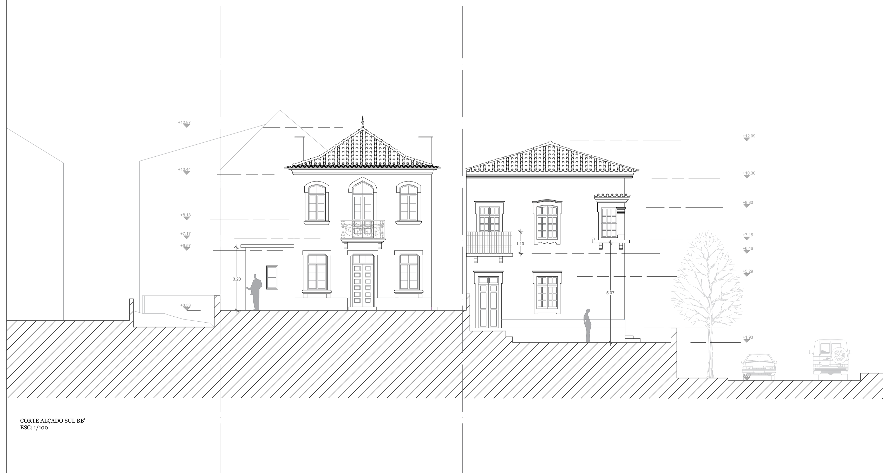
CORTE ALÇADO SUL BB' ESC: 1/100