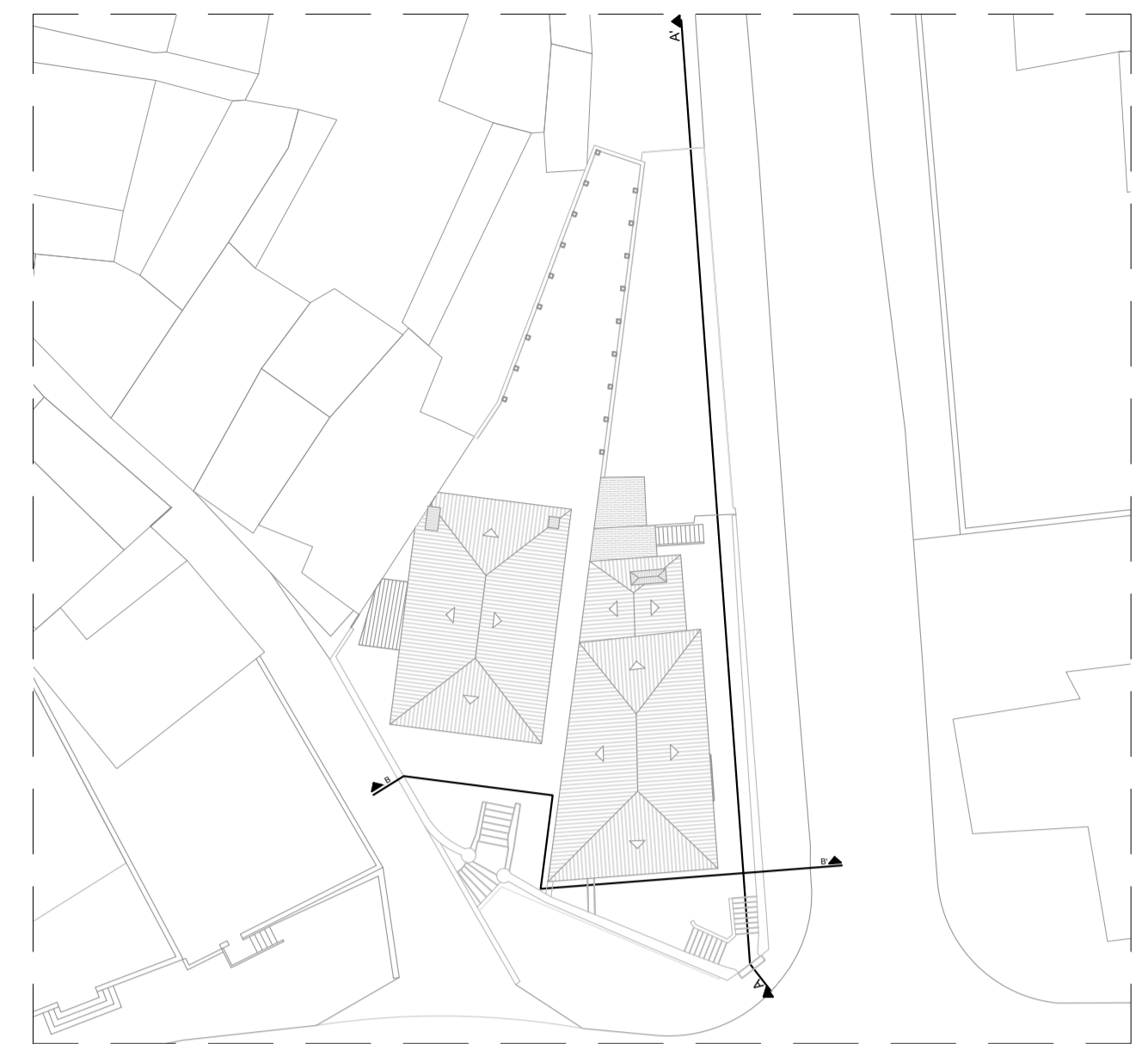
Ilustração 1 - Marcação de cortes