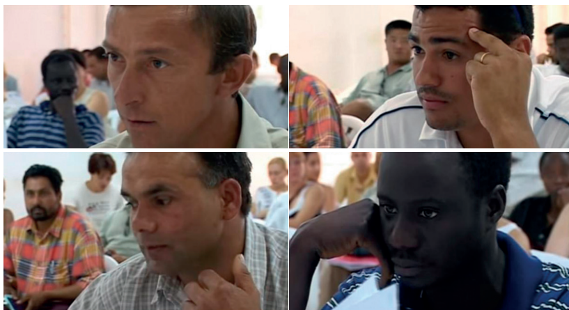
Fig. 2 Fotogramas de Lisboetas

Assim, todos são mostrados em uma mise-en-scène rígida, com enquadramentos em primeiro plano, que mostram com centralidade e muitos detalhes os rostos dessas pessoas que estão perdidas naquela situação. Ao fundo das imagens dos rostos, vemos outras pessoas, sentadas esperando para serem atendidas, que estão desfocadas na profundidade de campo, representando uma infinidade de outros imigrantes indefinidos, em busca de autorização de residência e de trabalho em Lisboa. Irônica e provocativamente, o filme, ao intitular-se Lisboetas , já é uma afirmação de que todos esses imigrantes são, efetivamente, parte integrante da cidade. Os cortes nesta cena só ocorrem quando muda o interveniente que é mostrado e, em todos os quatro casos, temos a mesma voz feminina da funcionária da SEF que os atende, mas não vemos seu rosto. O documentário a configura como uma agente que confronta com clareza burocrática as expressões dos imigrantes que, por sua vez, não conseguem entender as leis e regras que estão regendo suas vidas (Fig. 2).