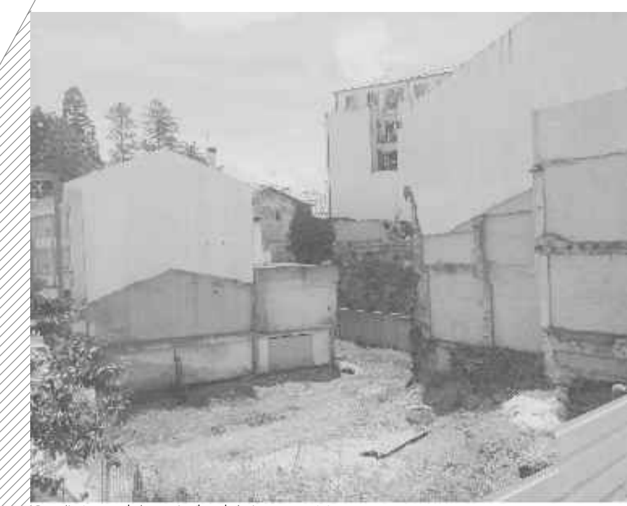
Condição atual do vazio (local de intervenção)