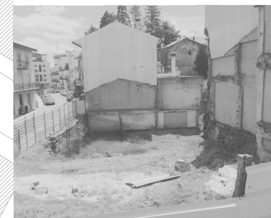
Lateral do lote, direcionada a Oeste