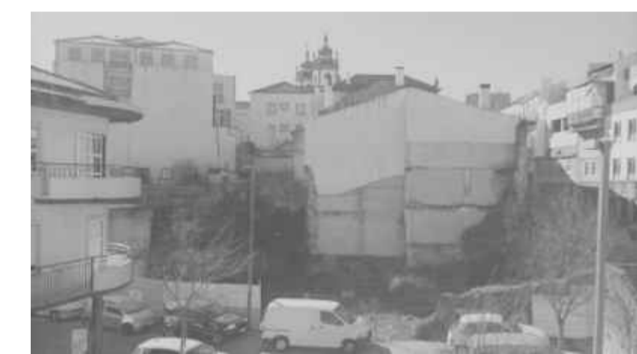
Frete principal do lote, direcionada a Norte