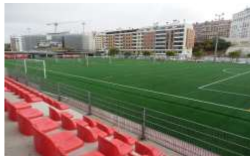
Figura 3 - Escolas de Futebol - Estádio da Luz