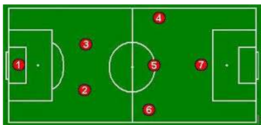
Figura 6- Sistemas Táticos Utilizados