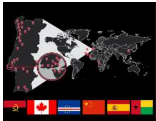
Figura 2- Escolas de futebol espalhadas pelo mundo

A Escola de futebol do Benfica está espalhada por todo o mundo e com uma prospeção elevada a nível mundial. Segundo Fernando Pinto (2016), na primeira ação de formação das Escolas de Futebol, foram contabilizadas 44 escolas de futebol em funcionamento diário durante a época desportiva. Dentro das 44 escolas de futebol são mais de 6500 jogadores, 350 treinadores e mais de 12000 pais, ou encarregados de educação. Atualmente as Escolas de Futebol do Benfica estão em atividade em 7 países (Portugal, China, Espanha, Cabo Verde, Angola, Guiné Bissau e Canadá) com o objetivo de ensinar e formar jogadores através da cultura e metodologia do clube. Para além destes objetivos a Escola de Futebol constrói valores pessoais nos jogadores como a honestidade, a interação com os colegas, a realização pessoal e o respeito entre jogadores e treinadores, jogadores e pais. É muito importante para um treinador da Escola de Futebol do Benfica ter ciente na realização do seu trabalho a multiplicidade de motivações a que dar resposta, assim como o respeito individual do jogador e a defesa da identidade do clube, princípios e valores. Dentro da metodologia do clube é um dos