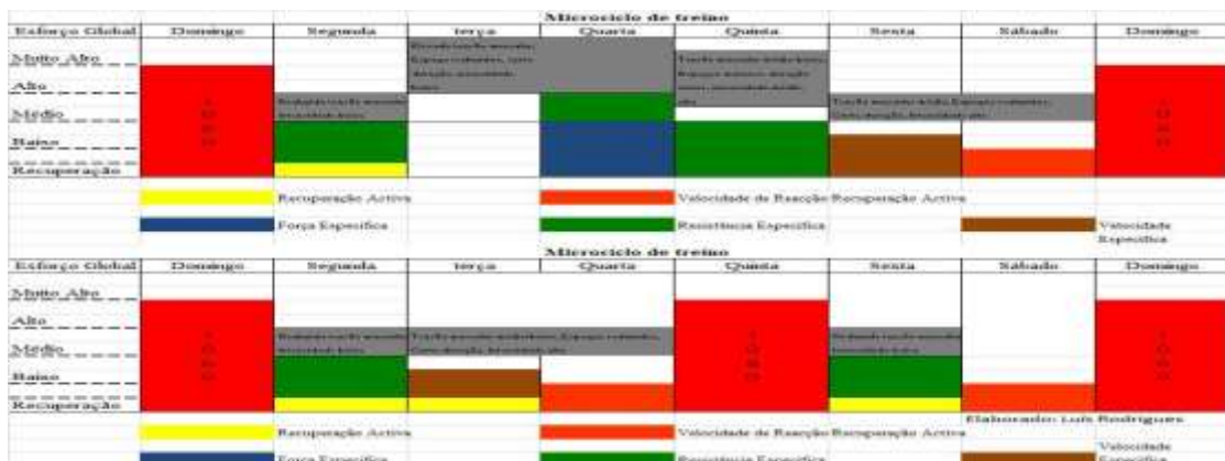
Figura 5- Exemplo de dois microciclos com 1 e 2 dias de competição

Quando falamos de microciclos na modalidade de futebol, o seu objetivo é efetuar uma preparação estrutural e organizada do futebolista para a competição. Esta preparação normalmente é efetuada semanalmente (7 dias) com 1 dia de jogo (competição). Equipas que participam em competições europeias podem ter que efetuar microciclos com 2 dias de jogo por semana. A partir desse conhecimento os treinadores utilizam estratégias e formas de planificação do seu microciclo, podendo alterar as suas variáveis (intensidade, volume, densidade, carga, duração, descanso, etc.) em função do que tem disponível. Através disso o treinador articula estas variáveis de forma a obter um pico de forma da equipa para a competição. Quando a equipa está presente em várias competições ao mesmo tempo o treinador tem uma dificuldade acrescentada para gerir o esforço da equipa porque o tempo de recuperação dos jogadores é menor. Segundo Clemente e Nikolaidis (2016), em desportos coletivos, como é o futebol, a intensidade do exercício deve ir de acordo os conteúdos de treino e da competição onde se está presente. Segue-se um exemplo de dois microciclos com 1 e 2 dias de competição semanal: