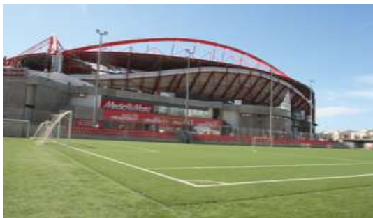
Figura 4- Escolas de Futebol - Estádio da Luz

De acordo informações recolhidas no site oficial do Sport Lisboa e Benfica ( www.slbenfica.pt ) as Escolas de Futebol do Benfica estão hoje espalhadas a nível nacional e internacional, com uma previsão para aumentar o número de escolas e de pessoas envolvidas nos próximos anos, com o objetivo de levar o nome do Sport Lisboa e Benfica e a sua forma de trabalhar por todo o mundo. A escola de futebol do estádio da luz está sediada no estádio do Sport Lisboa e Benfica na Avenida Eusébio da Silva Ferreira, 1500-313, Lisboa.