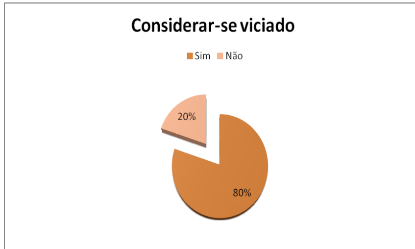
Gráfico 3: Respostas dos jogadores à pergunta 15 guião da entrevista: “Considera-se viciado?”