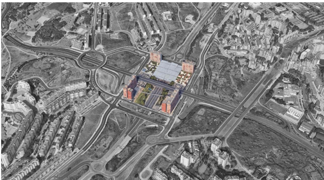
Figura 7 - Quadra Central de Chelas

Este núcleo central da malha apresenta-se também como espaço de distribuição do sistema viário de Chelas, visto ser, na maior parte das vezes, necessária a sua circulação pela Quadra, sempre que se pretenda deslocar entre bairros.