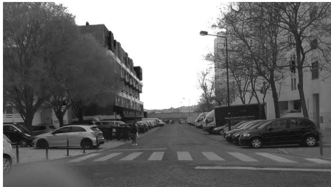
Figura 21 - Blocos na Av. João Paulo II