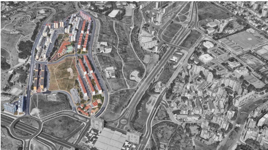
Figura 10 - Bairro da Flamenga

Na antiga Zona N1, na Av. Avelino Teixeira da Mota, o trajeto foi interrompido com o objetivo de observar o vale que separa esta avenida do conjunto habitacional 'Cindo Dedos', desta vez, do lado oposto e que geram um contraste com este vazio urbano. Devido à sua topografia e às características do solo, esta vasta área não foi edificada, remetendo-se a um espaço verde abandonado. É neste vale que se encontra o Parque Urbano do Vale de Chelas, onde a população aproveita de uma forma eficiente toda a sua extensão e as suas encostas através de pequenas hortas urbanas de que a comunidade usufruiu (Fig.11). Do lado oposto ao vale, os edifícios adquirem uma escala mais humana, revelando uma arquitetura discreta, com cores claras e alturas menores, graças às condicionantes impostas que, neste caso, são positivas e criam uma melhor imagem para o bairro (Fig.12).