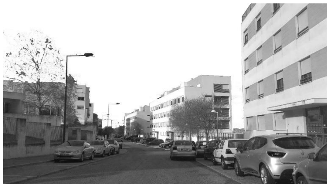
Figura 23 - Edifícios recentes da Av. Paulo VI