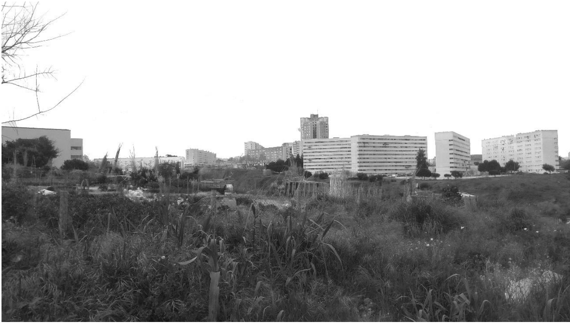
Figura 11 - Parque Urbano do Vale de Chelas - ao longe os edifícios do Bairro dos Loios