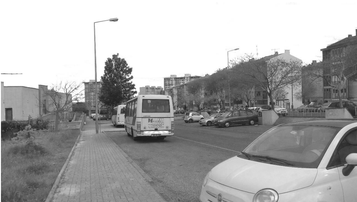
Figura 12 - Edifícios do Bairro da Flamenga (dir.)