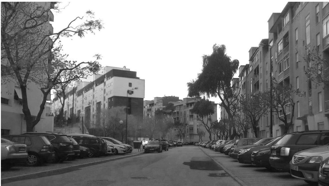
Figura 18 - Edifícios da Av. François Mitterrand