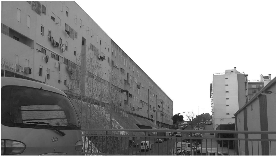
Figura 14 - Fachada lateral da 'Pantera Cor de Rosa'