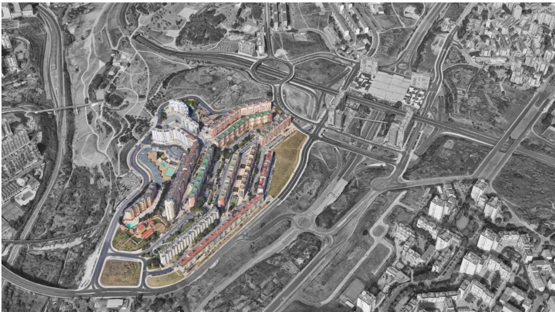
Figura 16 - Bairro do Armador

O bairro seguinte, o Bairro do Armador, parece ser a zona com as edificações em melhor estado de conservação, o que se traduz numa melhor qualidade do espaço e, conseqüentemente, numa aparente qualidade de vida melhor para a sua população, comparada com os restantes observados (Fig.17). Apesar da altura dos edifícios, a escala humana é tida em conta, sobretudo nos percursos pedonais. A arquitetura não se revela tão massiva e o desenho urbano parece mais coerente (Fig.18). Tal como os outros bairros, é rodeado de espaços verdes com tratamentos diferentes de acordo com a zona, com o Parque da Bela Vista a poente, hortas urbanas a norte e sul, e com espaços que variam entre hortas urbanas e espaços sem definição a nascente.