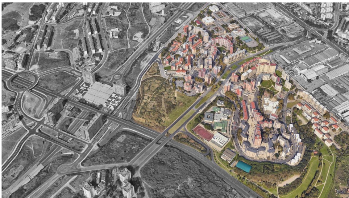
Figura 2 - Bairro das Amendoeiras

A seguinte paragem foi feita a noroeste do bairro, próxima do edifício da RTP e do espaço utilizado pela Feira do Relógio - realizada horas antes -, é constituída essencialmente por espaços verdes sem um propósito claro que rodeiam a Av. Santo Condestável, que são utilizados pela população como percursos pedestres informais (Fig.4). Deste local é possível observar os densos blocos do Bairro dos Loios, o conjunto habitacional 'Cinco Dedos' e, ainda, as recentes torres da Quadra Central de Chelas, a sul (Fig.5).