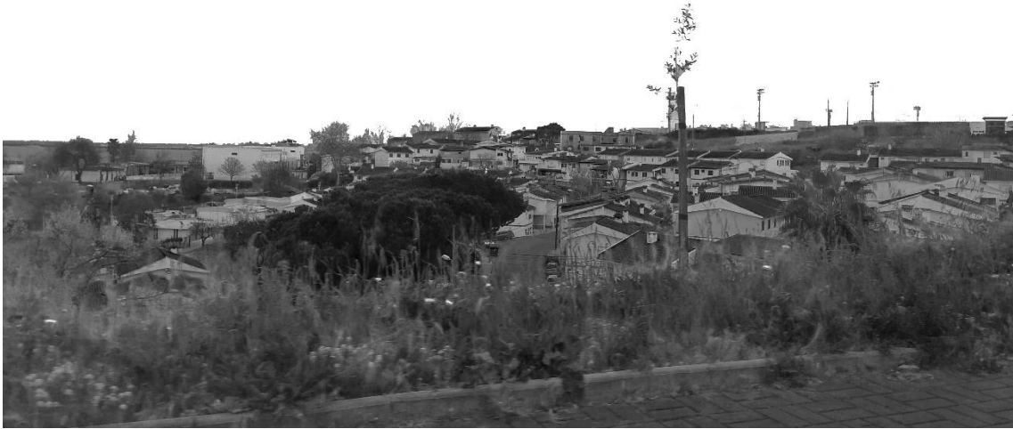
Figura 25 - Bairro Prodac - vista a partir da Av. Paulo VI