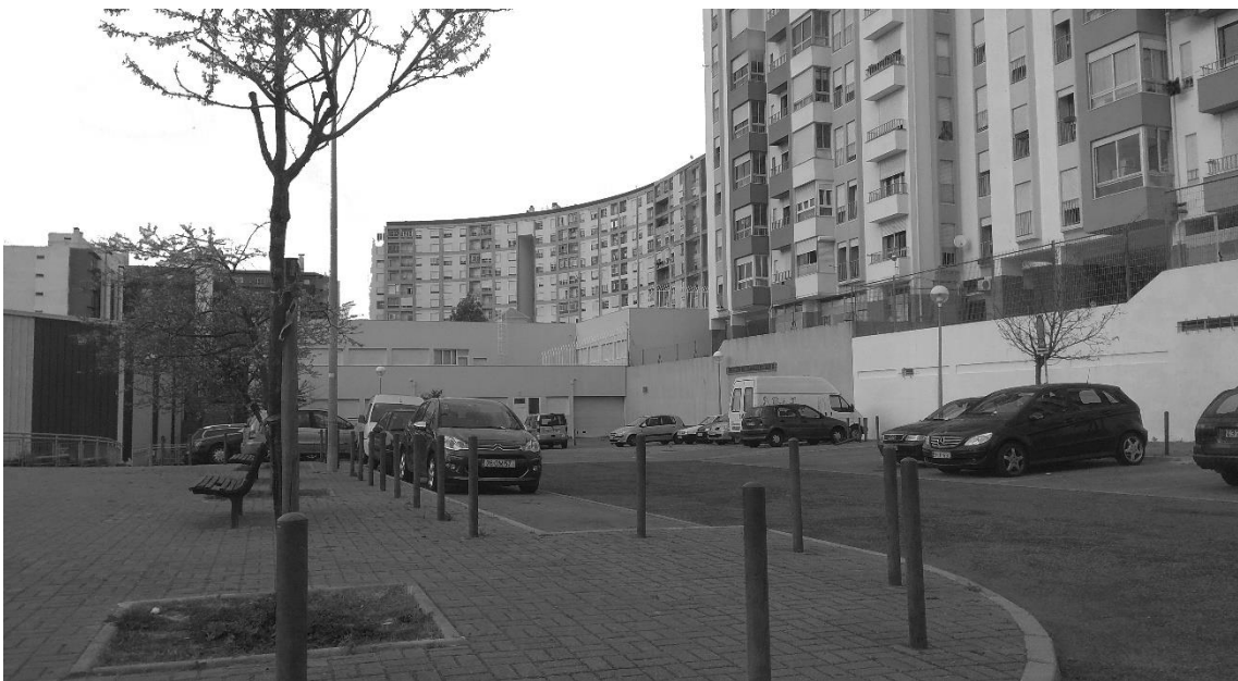
Figura 15 - Edifícios que 'envolvem' a 'Pantera Cor de Rosa'