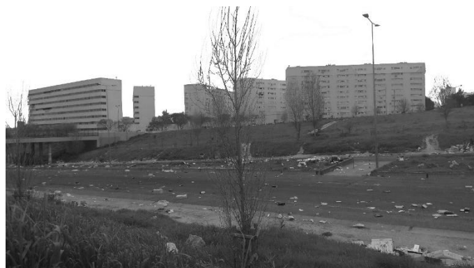
Figura 6 - Edifício 'Cinco Dedos' e Av. Santo Contestável após a realização da Feira do Relógio