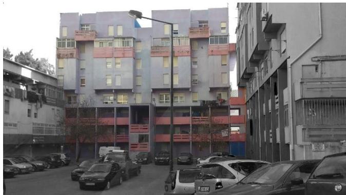
Figura 22 - Edifícios da Rua Botelho de Vasconcelos