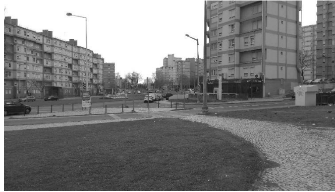
Figura 4 - Avenida Dr. Augusto de Castro