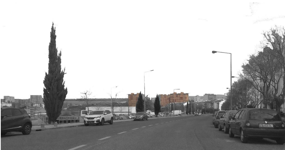
Figura 9 - Quadra de Chelas - vista a partir da Av. Avelino Teixeira da Mota (Zona N1)