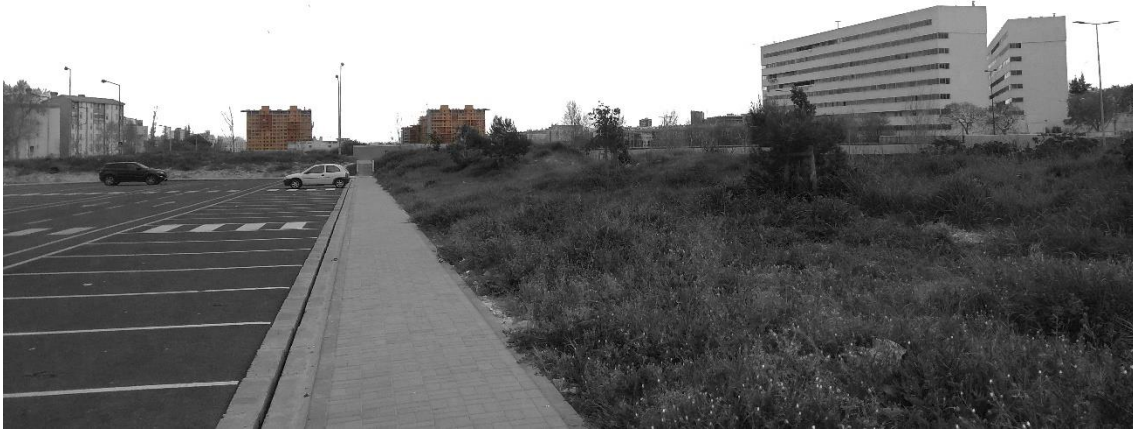
Figura 8 - Quadra de Chelas - vista a partir da Feira do Relógio (Zona I)