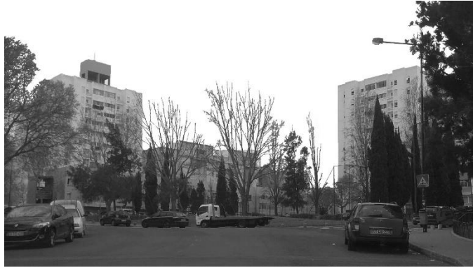
Figura 20 - Praça Dr. Fernando Amado