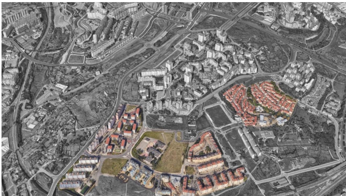
Figura 24 - Bairro das Salgadas (esq.) e Bairro Prodac (dir.)

Dado que já não pertencem à área do PUC, os dois bairros restantes, Salgadas e Prodac, foram visitados de forma rápida. Este bairro encontra-se na localização do antigo Bairro Chinês que foi renomeado após a sua reconstrução e é constituído por moradias unifamiliares de pequenas dimensões. Devido às suas ruas estreitas e à sua organização orgânica, este local parece um povoamento rural perdido num dos vales de Chelas (Fig.24 e 25). O Bairro das Salgadas por sua vez tem características em comum com o Bairro do Condado, com edifícios de elevadas dimensões que nos “sufocam” algumas zonas e com muitos poucos percursos pedonais (Fig.26).