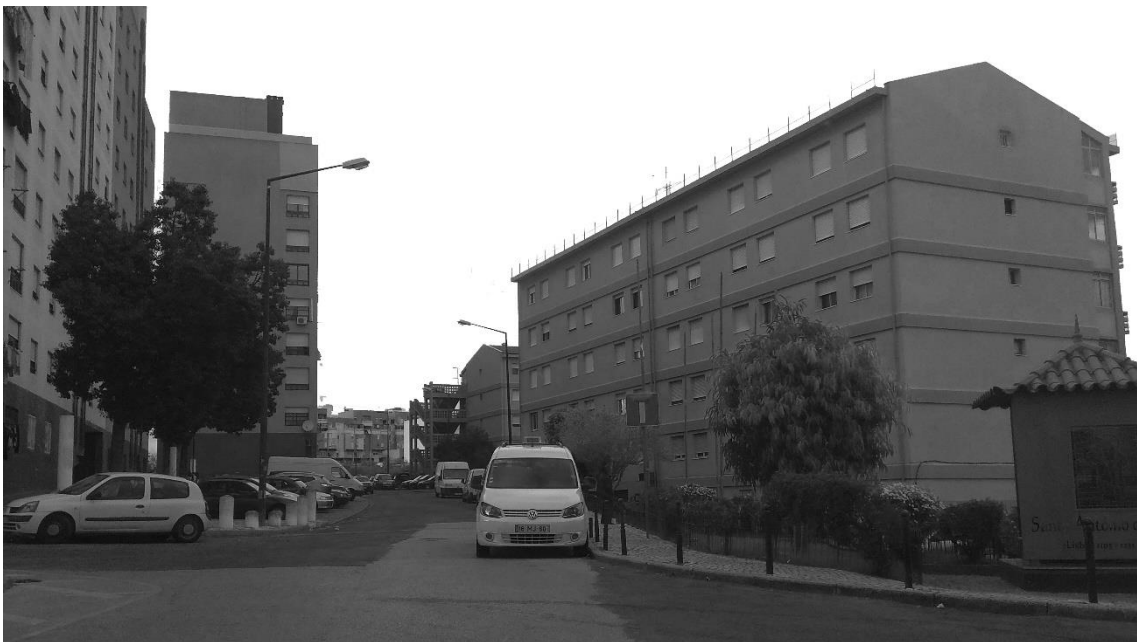
Figura 26 - Rua Artur Duarte - Bairro das Salgadas