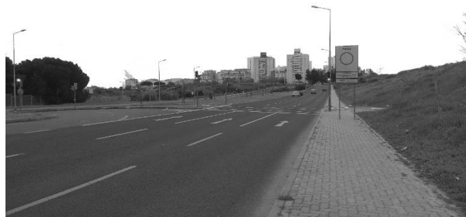
Figura 3 - Vazios urbanos entre os Bairros das Amendoeiras e do Condado