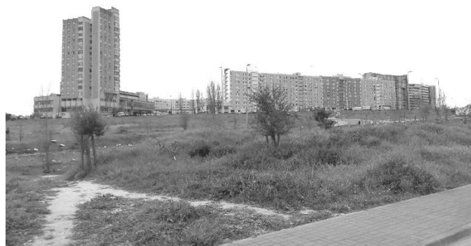
Figura 5 - Espaço verde que rodeia a Av. Santo Contestável e edifícios do Bairro dos Loios