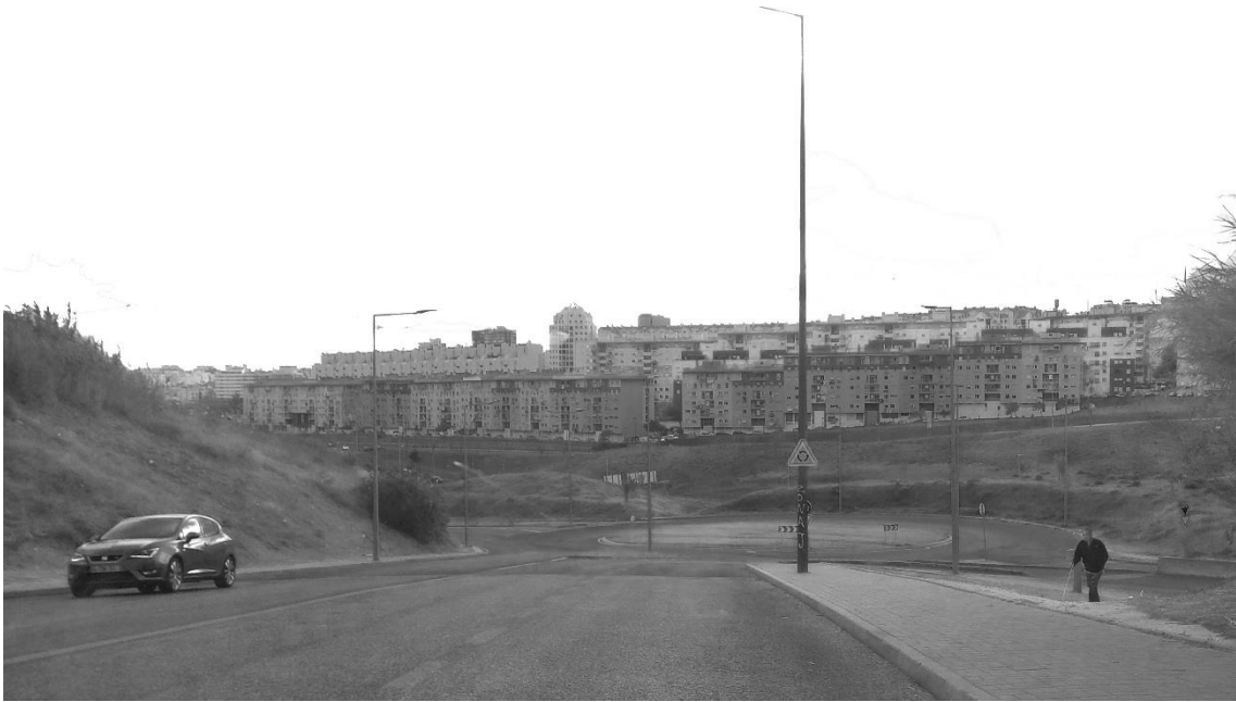
Figura 17 - Bairro do Armador - vista a partir do Bairro do Condado