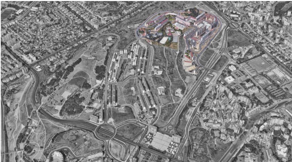
Figura 13 - Bairro dos Loios

O percurso pelo Bairro dos Loios realizou-se pela Rua Pardal Monteiro, o limite do bairro - a estrada encontra-se a uma cota superior entre o edificado e a escarpa que se desenvolve ao longo da Av. Gago Coutinho. À medida que circulamos entre os edifícios, um conjunto de edificações de cor rosa destaca-se, não só pela cor, mas também pela sua monumentalidade, configurando o conjunto apelidado de “Pantera Cor de Rosa”. Apesar da alegada reputação que esta zona teria não foi sentida insegurança durante a visita (Fig.14). Envolver este conjunto habitacional encontram-se, a nascente, um núcleo de edifícios em altura aparentemente de forma desordenada e sem atenção à escala humana, enquanto que a poente se encontram edifícios em bloco e paralelos às ruas que os limitam (Fig.15). De ressaltar, ainda, a dimensão exagerada das vias da rua Luís Cristino da Silva e, mais uma vez, o sentimento de pequenez quando se atravessa a via.